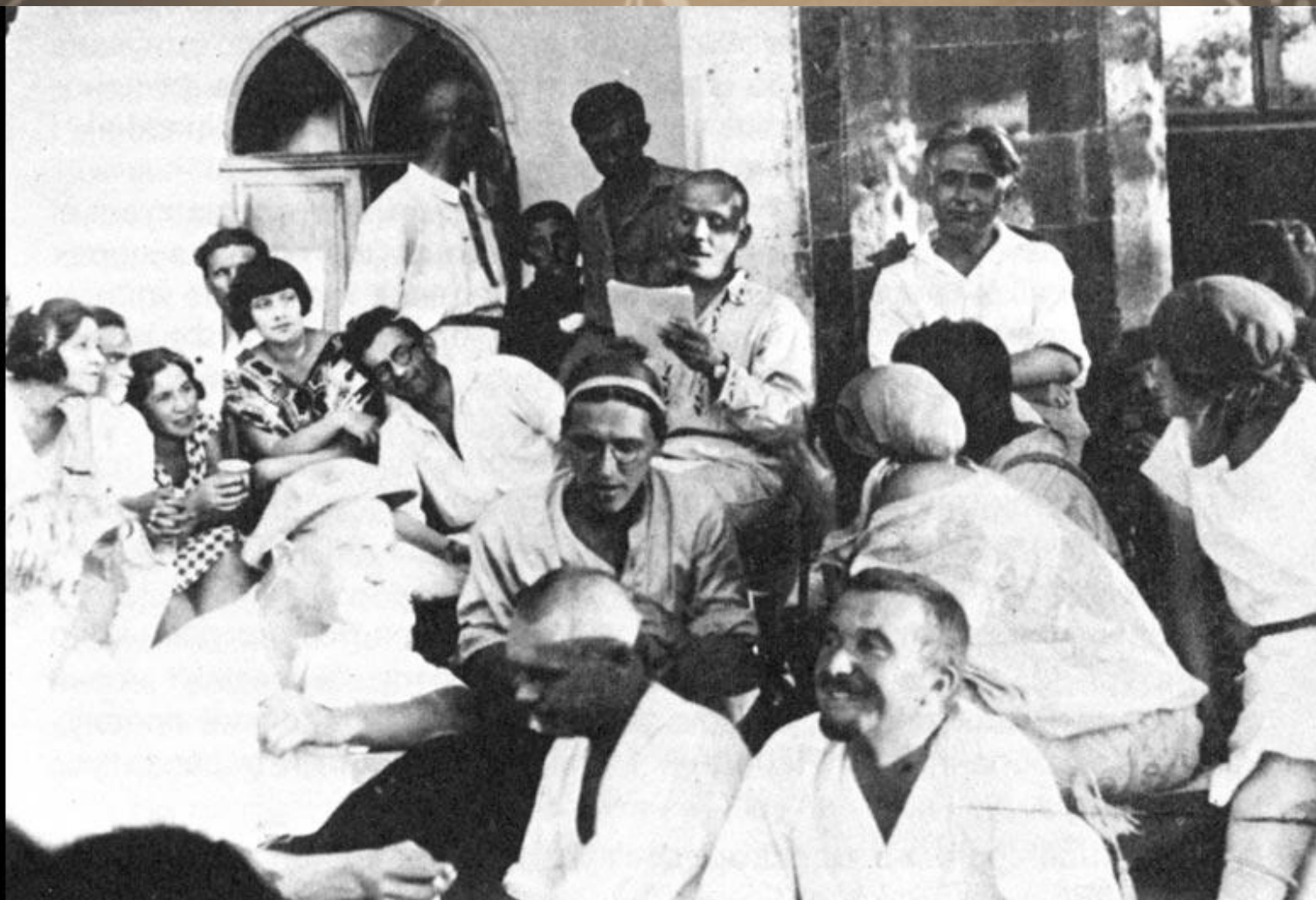
Микола Куліш читає березильцям "Народного Малахія", 1927 р.