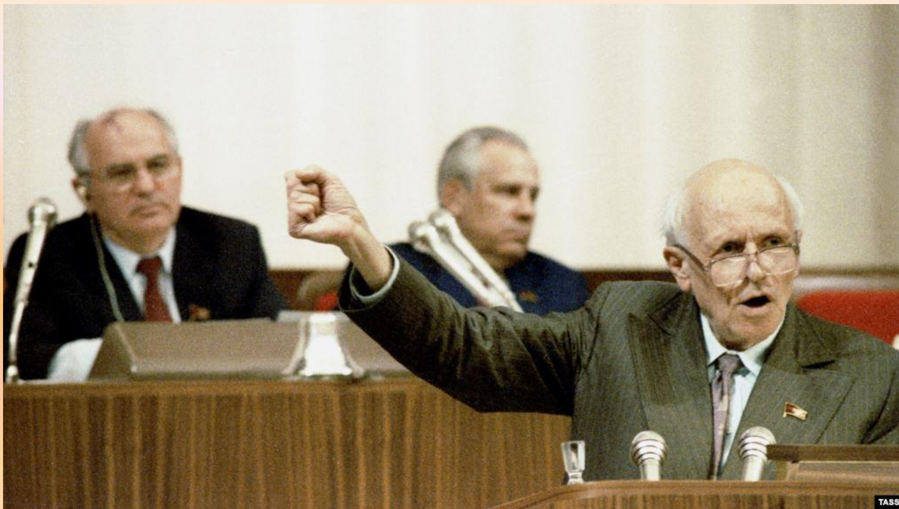
А. Д. Сахаров выступает на I Съезде народных депутатов СССР. Москва, 1989 г.