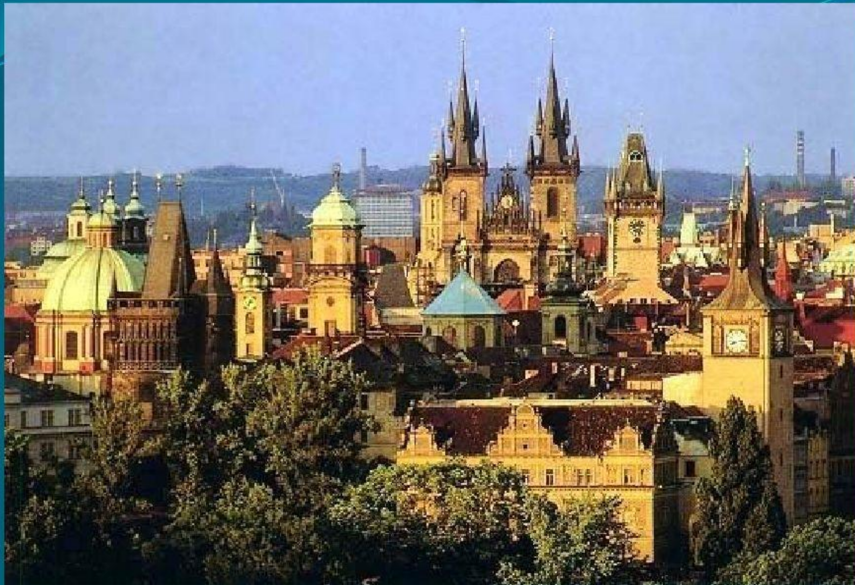
Католический собор в Сантьяго (Чили).