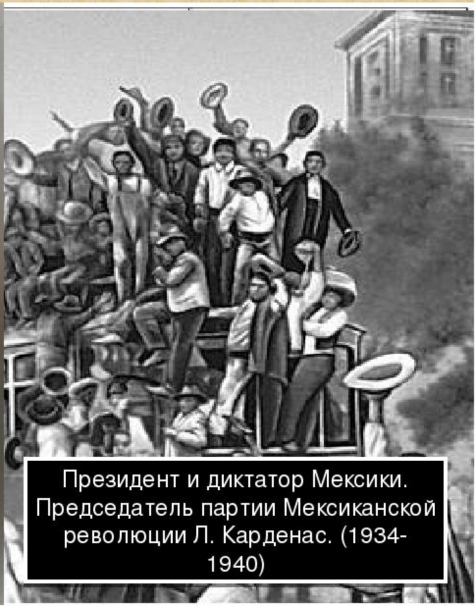
Президент и диктатор Мексики. Председатель партии Мексиканской революции Л. Карденас. (1934- 1940)