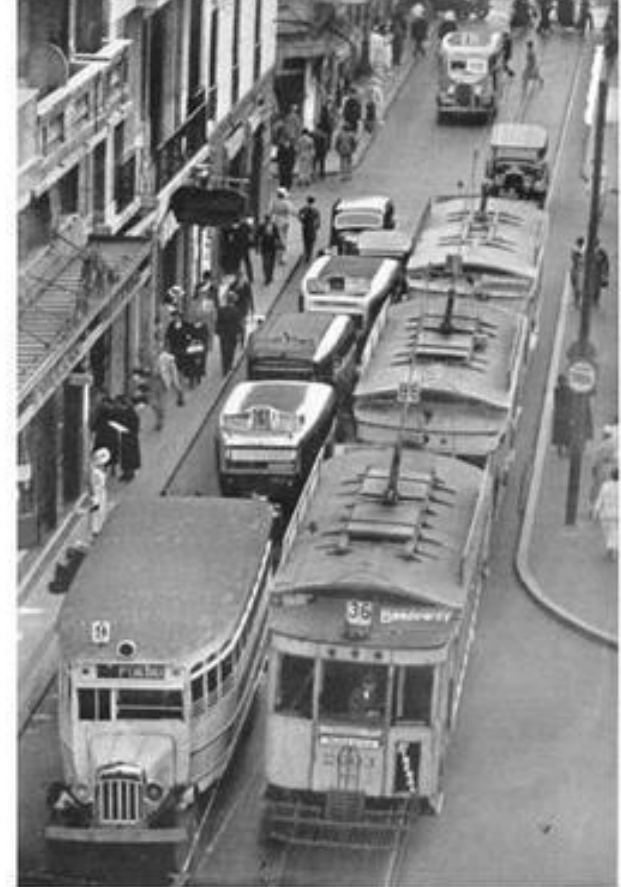
Улица Сармьенте в Буэнос-Айресе