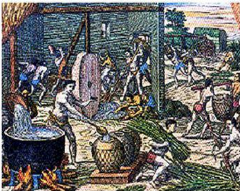
Производство сахара в колониальной Венесуэле

Латифундии (лат. Latifundia ) — в Латинской Америке название обширного поместья, обрабатываемого трудом рабов, а в последствии после отмены рабства, дешевых работников.