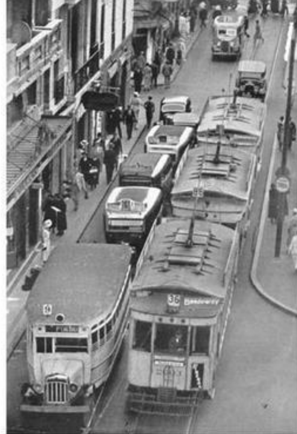
Улица Сармьенте в Буэнос-Айресе