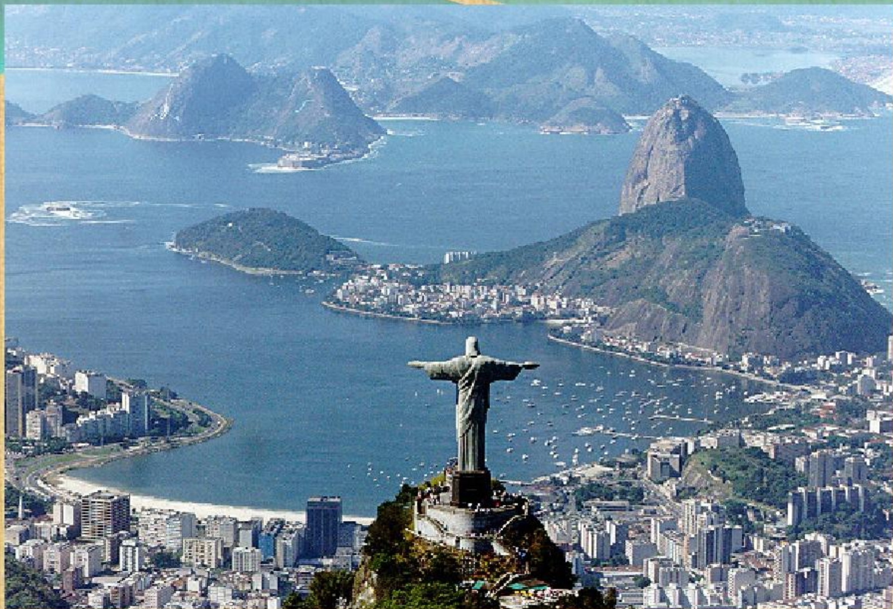
Рио-де-Жанейро (Бразилия). Современный вид.