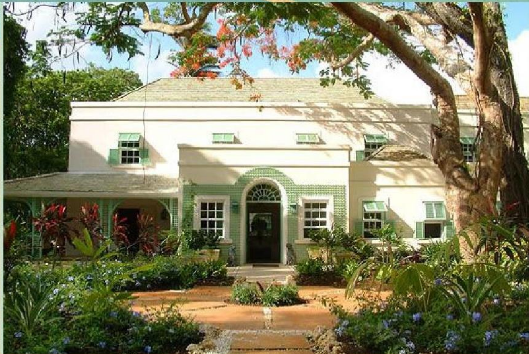
Поместье латифундиста в Бразилии