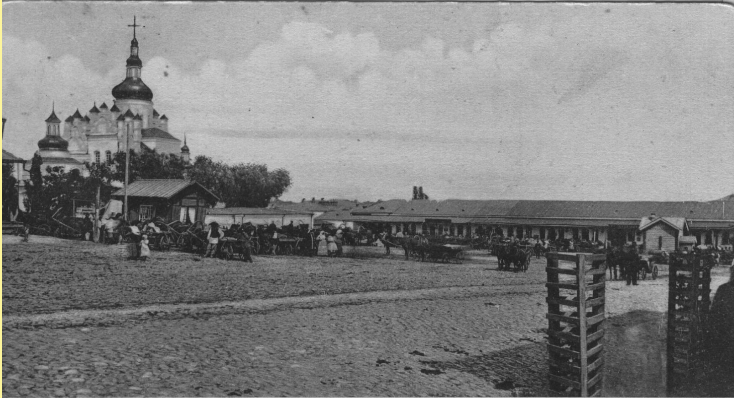
Черниговъ — Пятницкая церковь