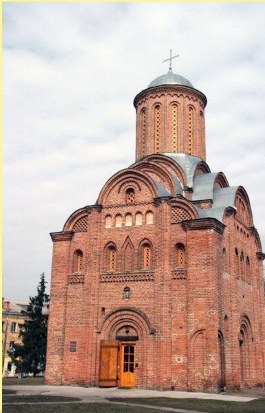
Пятницкая церковь сейчас