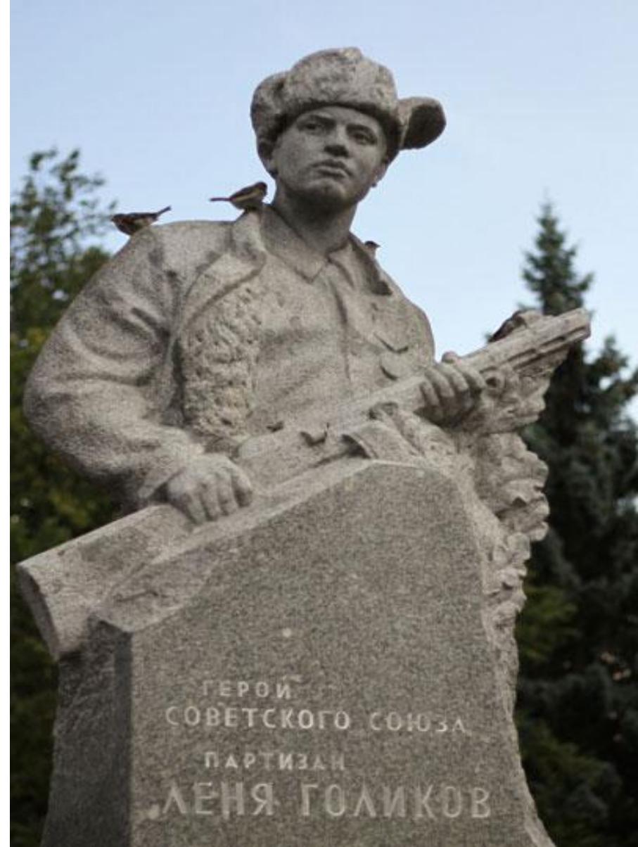
Памятник Лёне Голикову в Великом Новгороде

Память о Лёне Голикове сохранена в памятниках, названиях улиц, школ, кораблей.