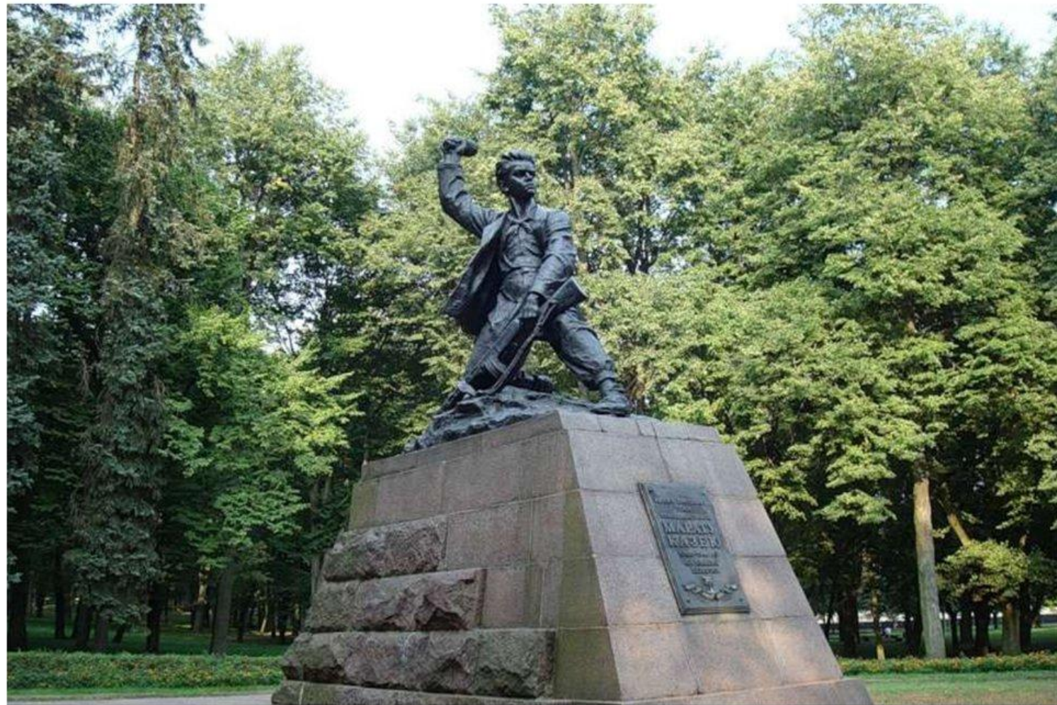
Памятник Марату Казею