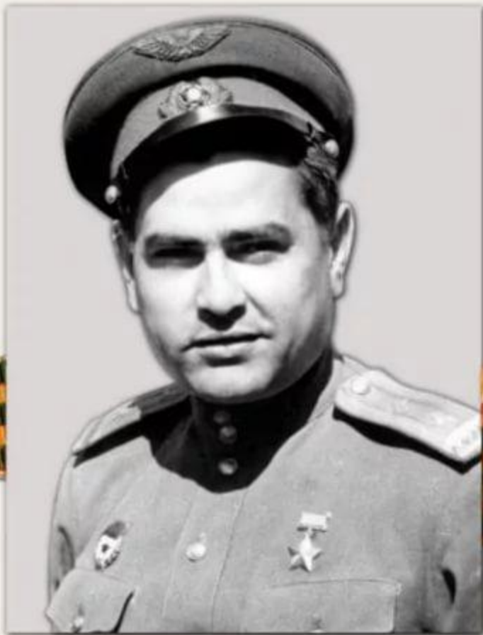
МАРЕСЬЕВ АЛЕКСЕЙ ПЕТРОВИЧ (1916г. - 2001г.)

Маресьев Алексей Петрович летчик- истребитель, заместитель командира эскадрильи 63-го гвардейского истребительного авиационного полка, гвардии старший лейтенант