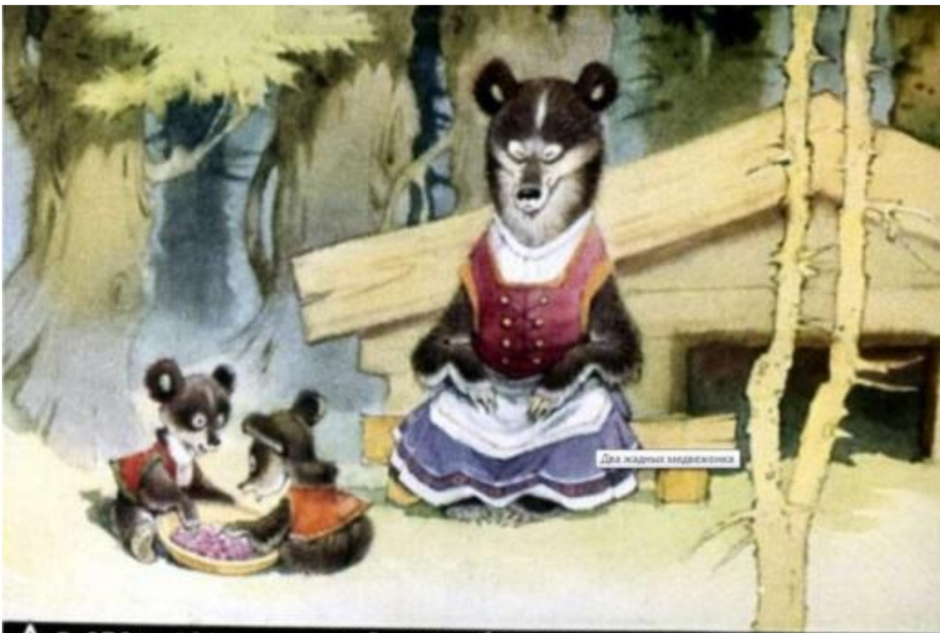
Для жадных медвежат

А в этом лесу, в самой чащобе, жила старая медведица. Было у неё два сына.