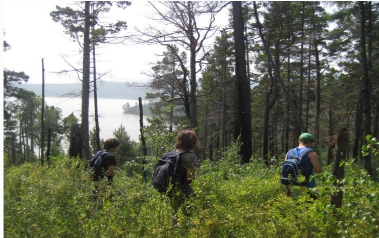
Научная экспедиция на Байкале