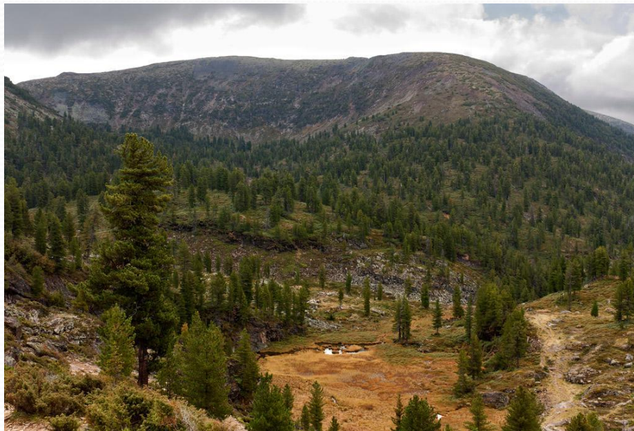
Кедровые леса Байкала