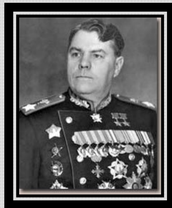
Малиновский Родион Яковлевич Дважды Герой Советского Союза, Маршал Советского Союза