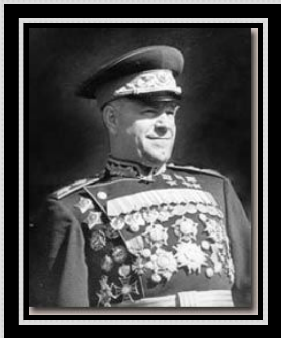
Жуков Георгий Константинович Четырежды Герой Советского Союза, Маршал Советского Союза