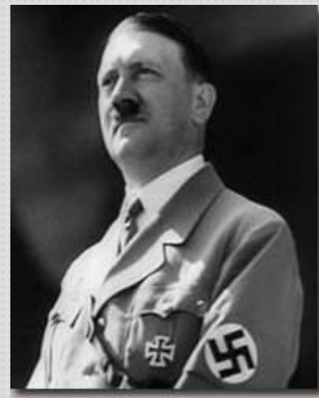
Адольф Гитлер Глава (рейхсканцлер) Третьего рейха, главный военный преступник Второй мировой войны

По планам гитлеровских генералов война должна была продлиться всего несколько месяцев. До нападения на СССР Германия захватила все танки, самолеты, заводы и рабочую силу Европы. Враг был жестокий и сильный.