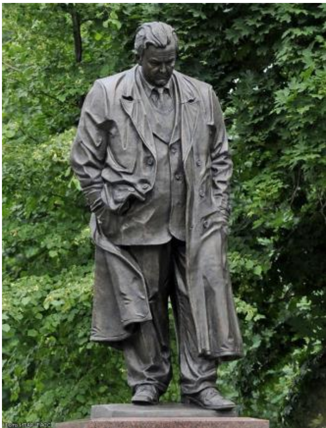
Памятник А. Т. Твардовскому в Москве (открыт в 2013 году).