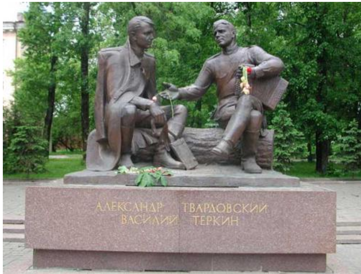
Памятник А. Т. Твардовскому и Василию Теркину в Смоленске (открыт в 1995 году).