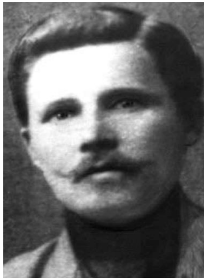
Отец , Трифон Гордеевич Твардовскогий, был деревенским кузнецом