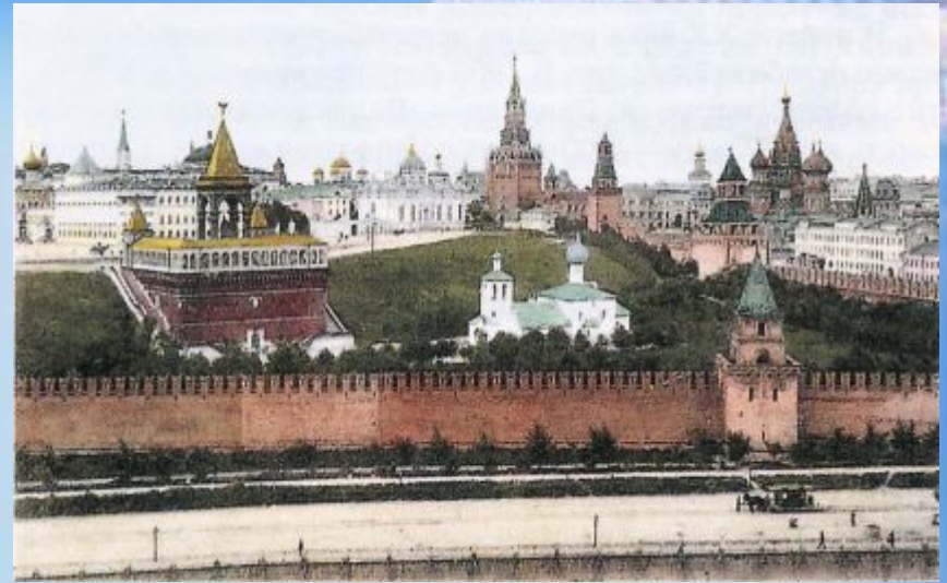
Архитектурный ансамбль московского кремля