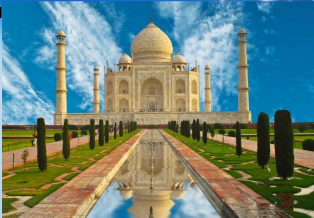
Тадж-Махал. Агра. Индия