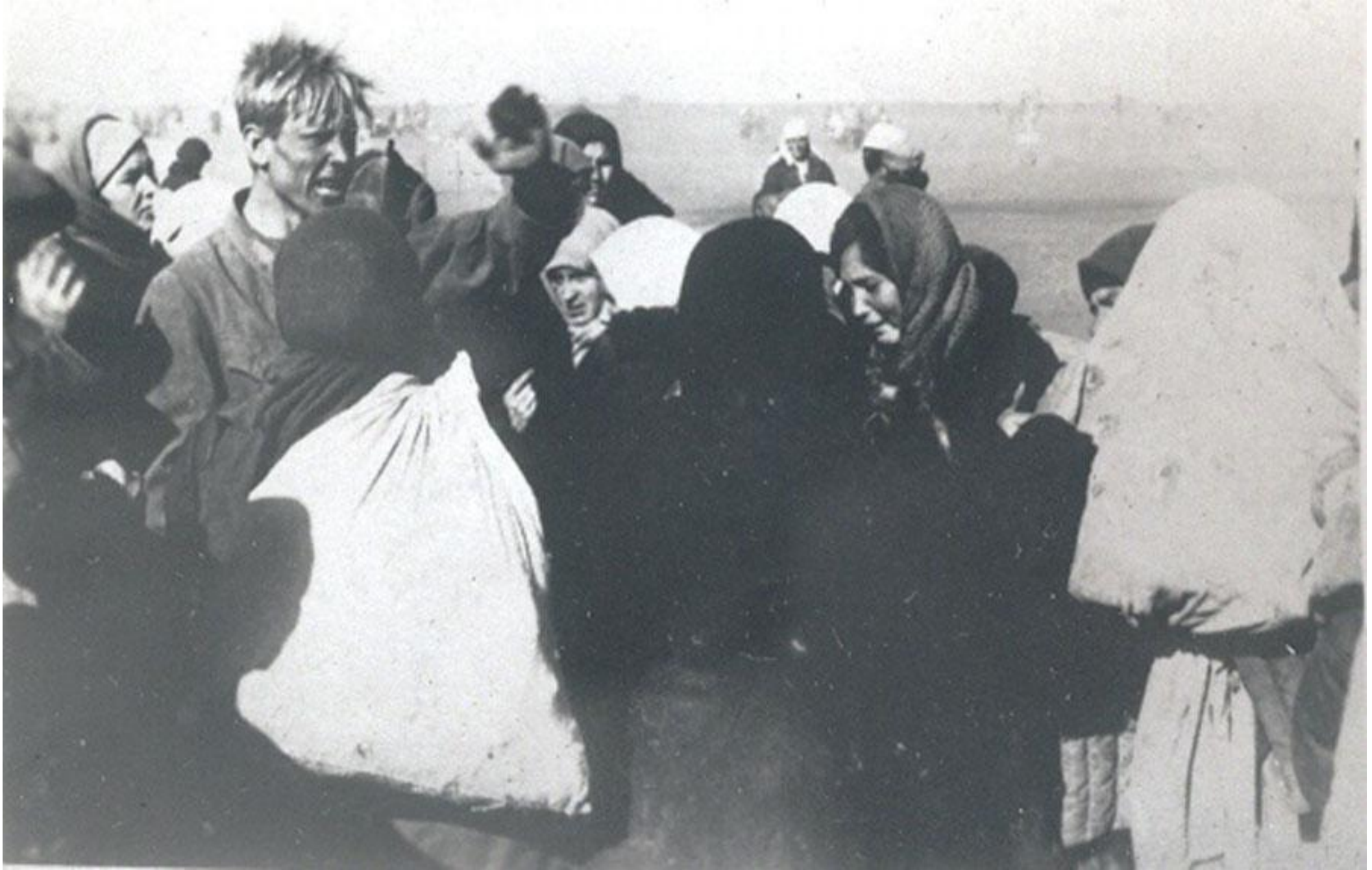
• Жители Сталинградской области, угоняемые в Германию. 7 октября 1942 г.