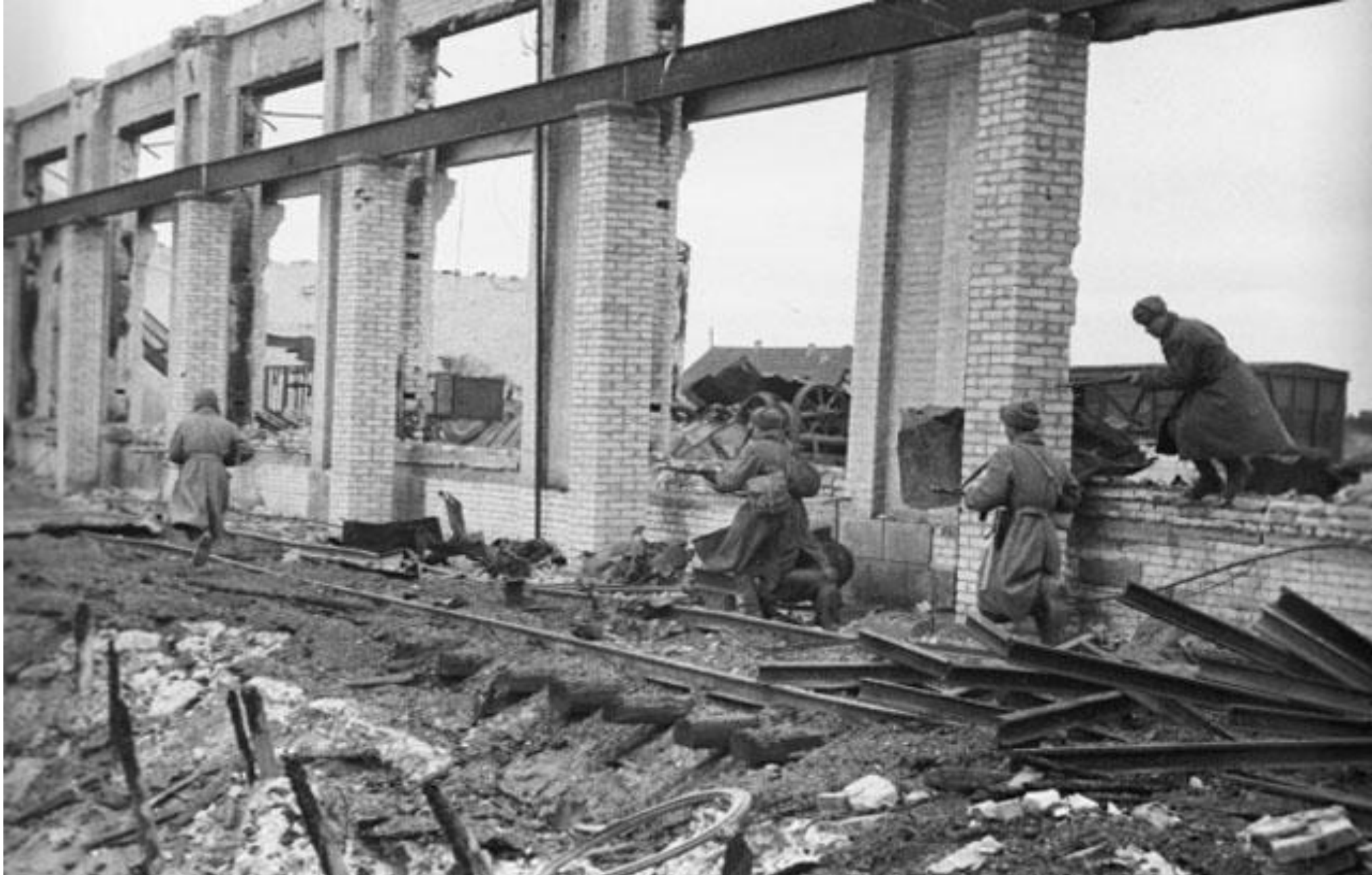
• Советские солдаты во время одного из уличных боёв в Сталинграде