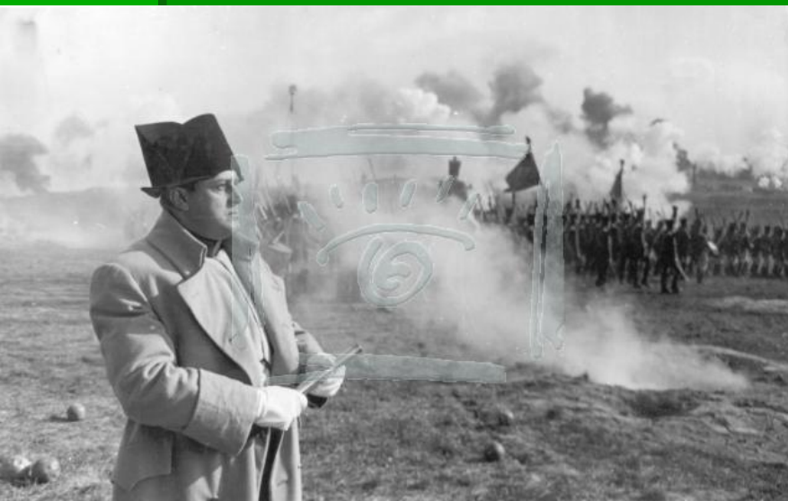
Кадры из фильма «Война и мир».

История детерминирована некими закономерностями, проявляющимися в действиях больших масс людей – народа. И в историософских размышлениях Толстого ярко выражено его подчёркивание преимуществ народа и исторических деятелей, выражающих его волю.