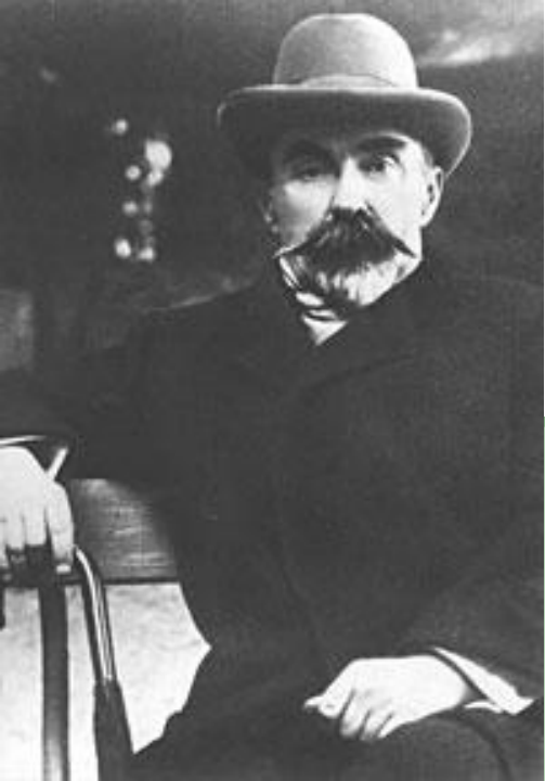
Плеханов – главный критик волюнтаризма

■ истории, определяемые более глубокими и носящий объективный характер закономерностями.