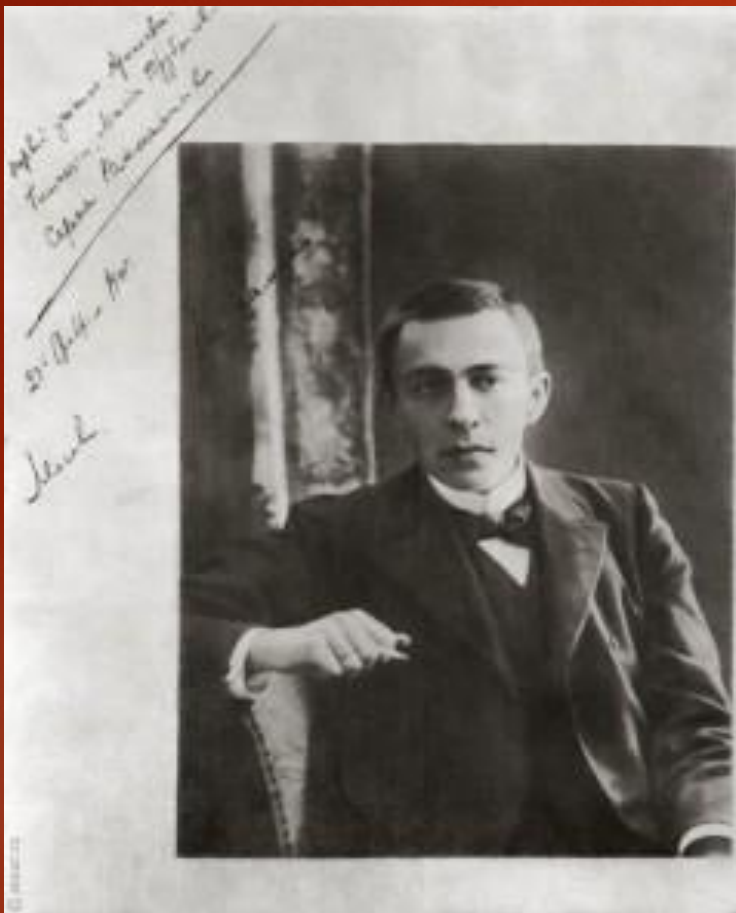
1904. ДАРСТВЕННАЯ НАДПИСЬ А.А.ТРУБНИКОВОЙ