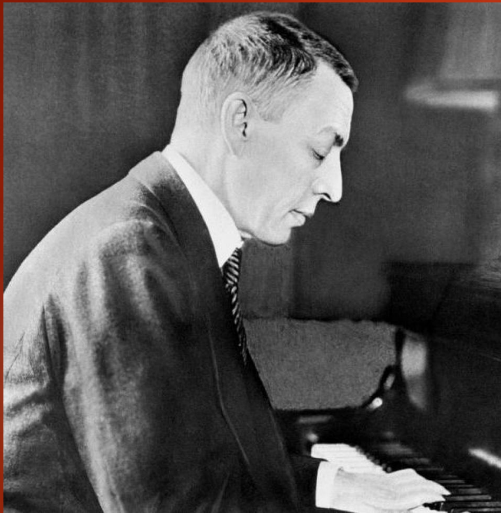
ЗА РАБОТОЙ 1921Г.