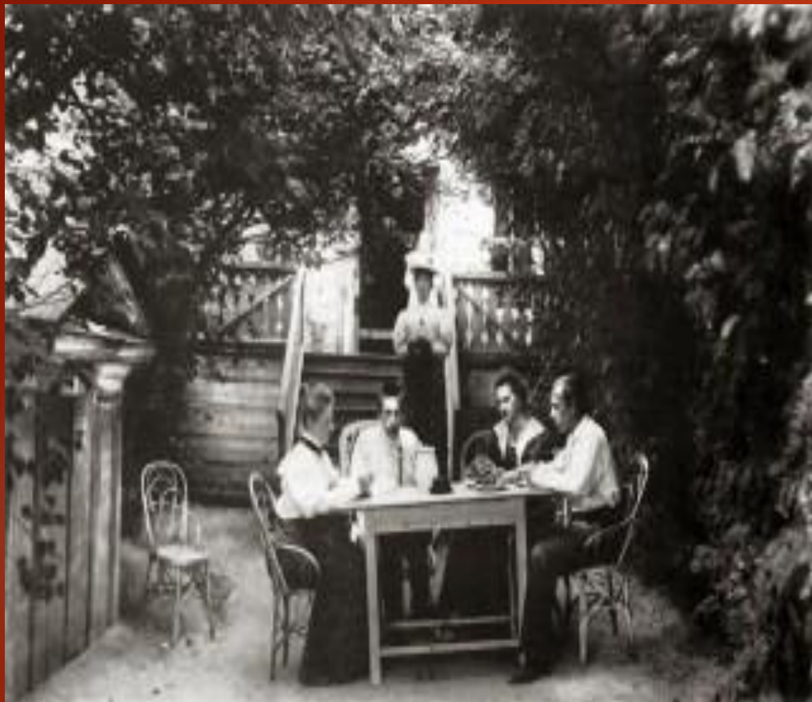
1897. С РАХМАНИНОВ, В.Д. СКАЛОН, Л.Д. И Н.Д. СКАЛОН В ИМЕНИИ ИГНАТОВО