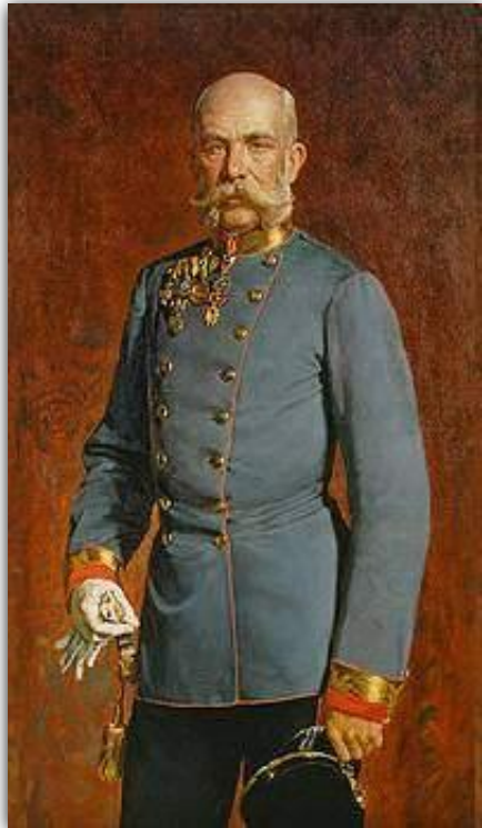
Австрийский император Франц Иосиф