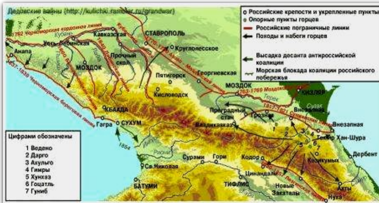
Карта Кавказской войны 1817-64 гг.