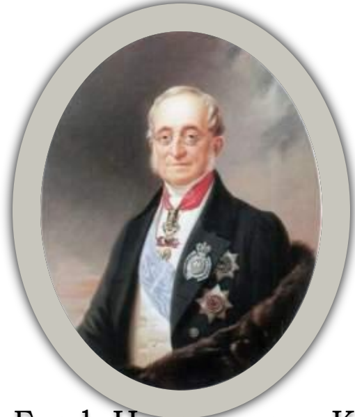
Граф Нессельроде Карл Васильевич (1780-1862), канцлер, Министр иностранных дел (1816-1856).

Противодействие европейскому революционному движению (через «Священный союз»)