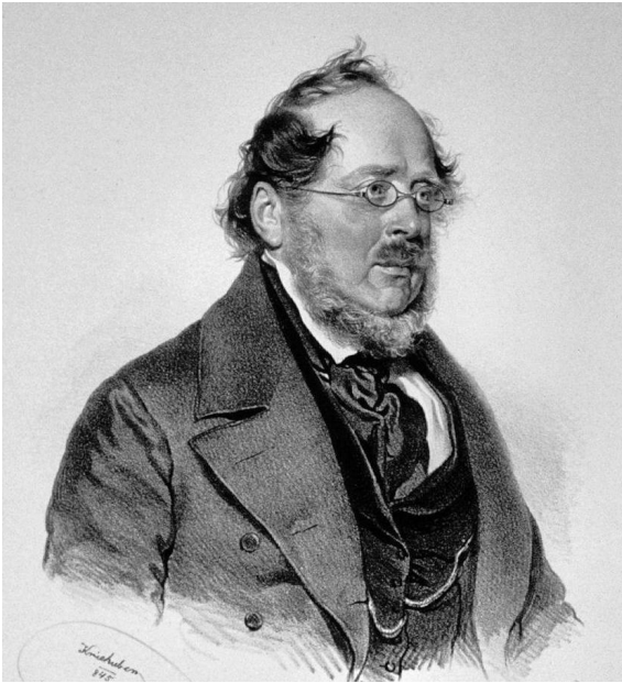
Фридрих Лист (1789-1846)

Основатель немецкой школы экономики, политик и публицист.