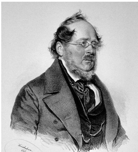
Фридрих Лист (1789-1846)

Основатель немецкой школы экономики, политик и публицист.