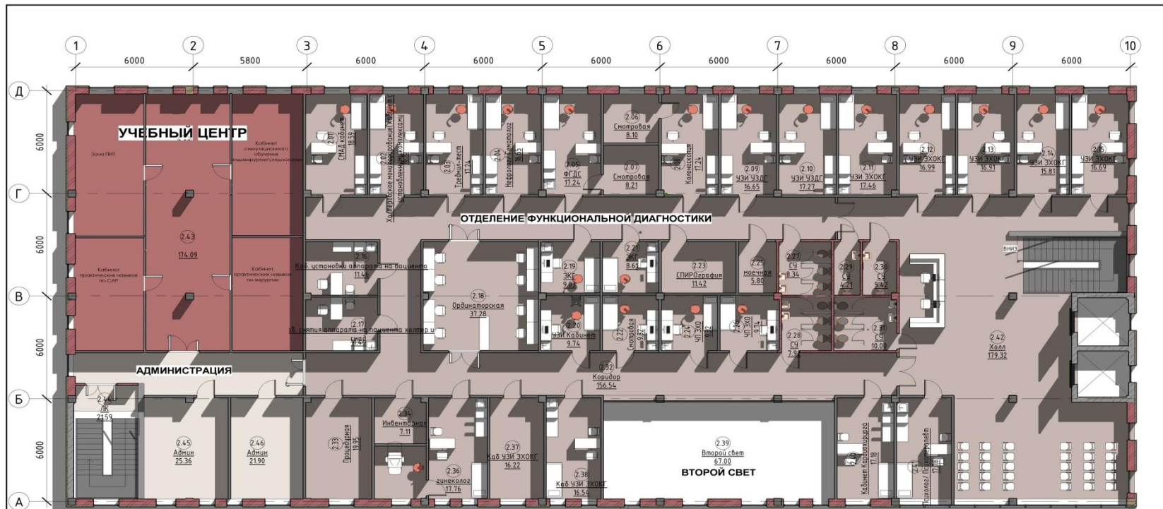
Спецификация помещений 2 этажа