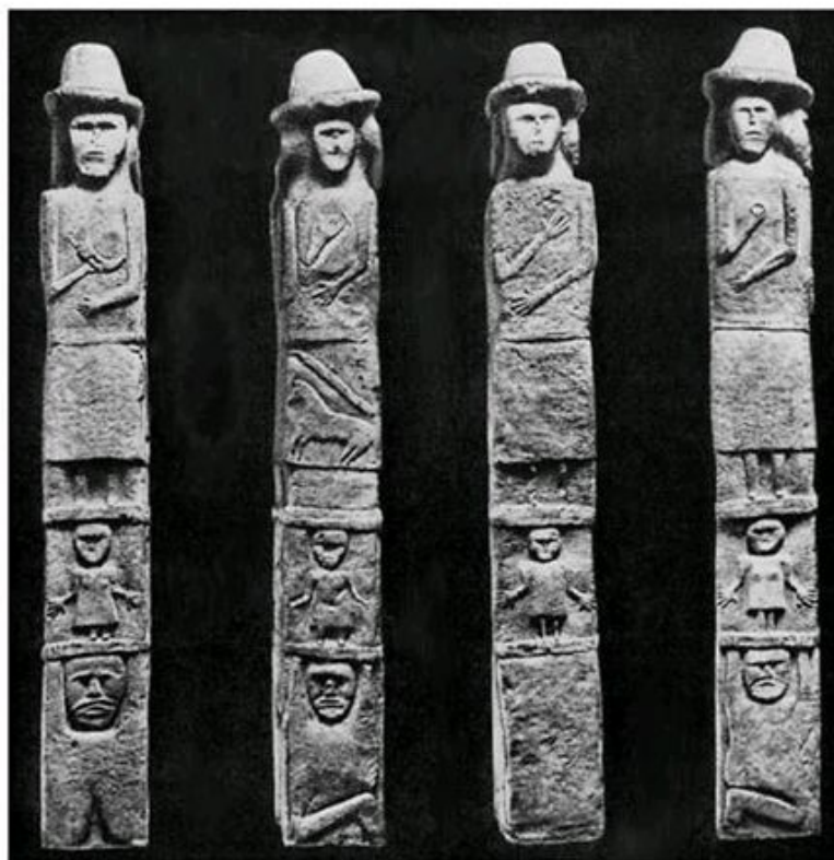
ЗБРУЧСКИЙ ИДОЛ. СВЯТОВИТ-РОД. IX в. н. э.