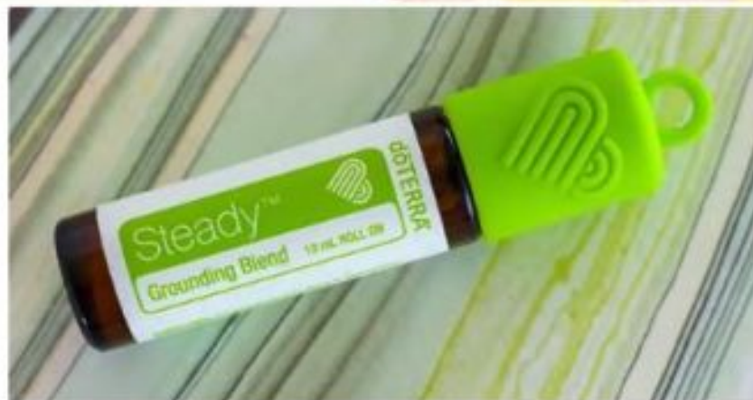
Steady® Grounding Blend/ Смесью эфирных масел для эмоционального равновесия