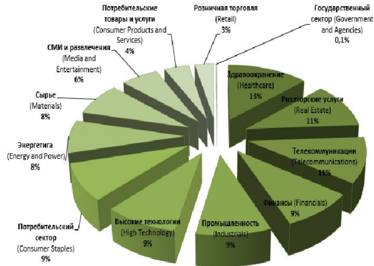
Рисунок - М&А в мировой практике в разрезе на отрасли