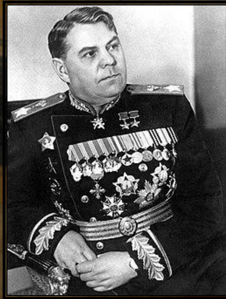
Василевский, Александр Михайлович