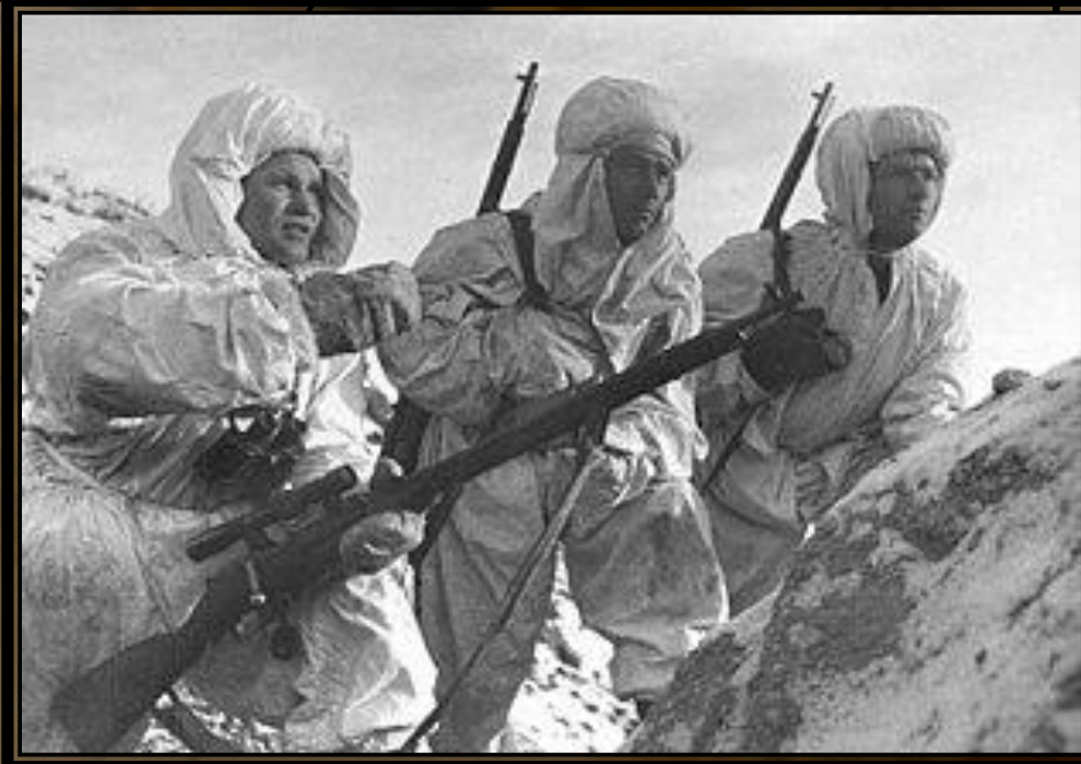
Васілій Григор'євич Зайцев