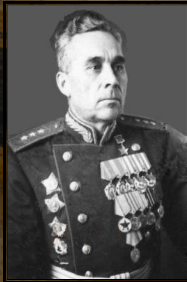
Васі́лій Никола́евич Го́рдов