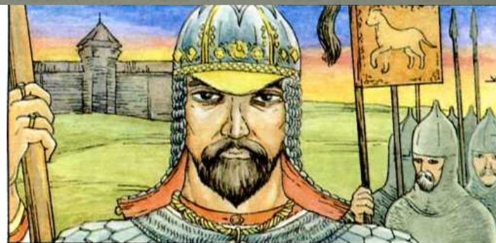
Царь Алмуш. На гербе Волжской Болгарии был изображен шагающий барс.

Аслё Атёл шыв.нчен б =ухрёмра Пёлхар хули сарёлса выртать? Кунта Хура палата: +ур=.р тата Тухё= масар.сем: К.=.н минаретпа вырёс чирк.в. аякранах курёна==.? Пёлхар хули Х .м.р пу=ламёш.нче аталанма пу=ланё: кунта сугу-ил\ тума: курма- в.ренме аякри Византипе иранран: китайпа Тибетран: ёсчахсем: ● =ул=\рев=.сем килсе тёнё?