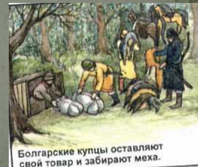
Болгарские купцы оставляют свой товар и забирают меха.