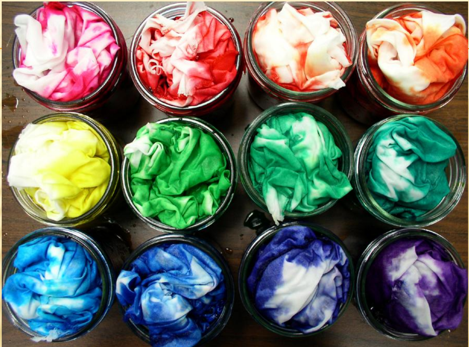
Синтетические краски на ткани