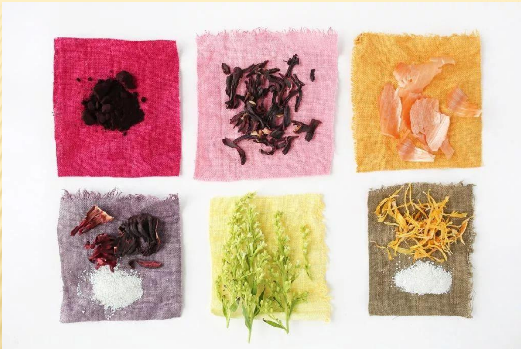
Натуральные красители на ткани