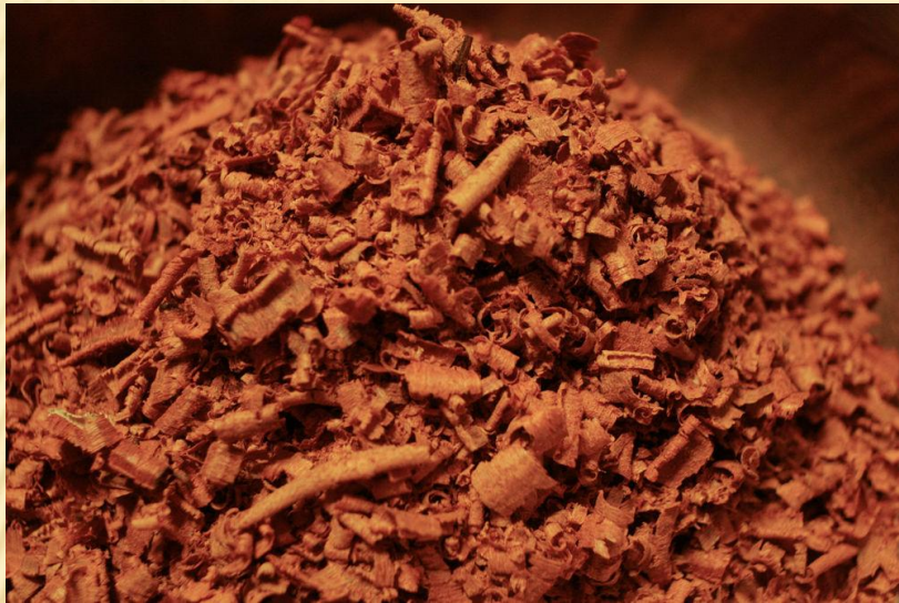
Кампешевого дерева (logwood), натуральный краситель