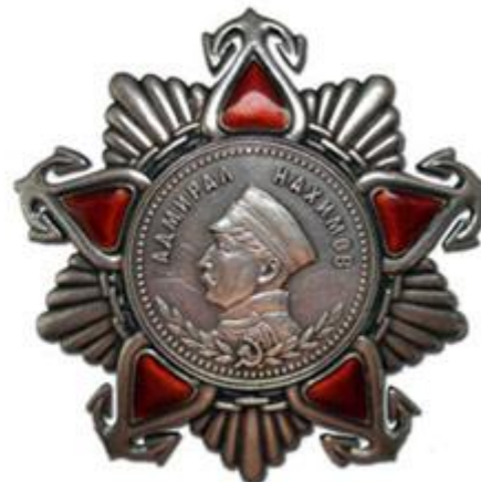
Ордена и медали СССР - награды Великой Отечественной войны.