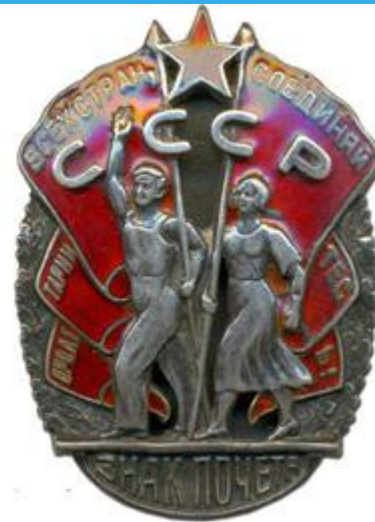
Первые ордена и наградные медали СССР