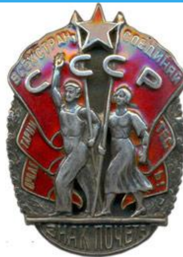
Первые ордена и наградные медали СССР