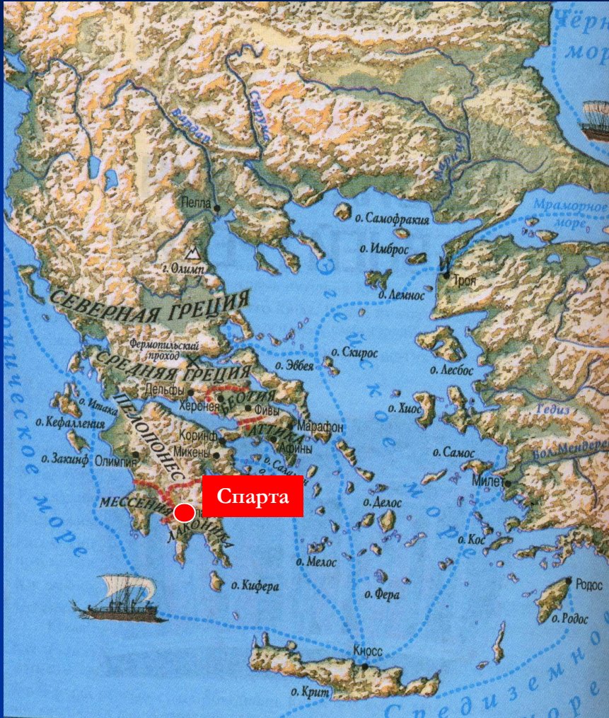
Древняя Греция. Карта

Спарта – главный город области Лакония (Пелопоннес)