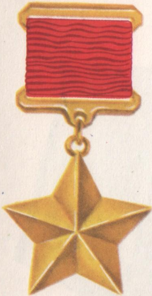
Медаль „Золотая Звезда“

Медаль «Золотая Звезда» является знаком отличия для лиц, удостоенных высшей степени отличия СССР — звания Героя Советского Союза. Медаль изготовлена из золота и имеет форму пятиконечной звезды. На оборотной стороне медали надпись «Герой СССР» и номер медали.