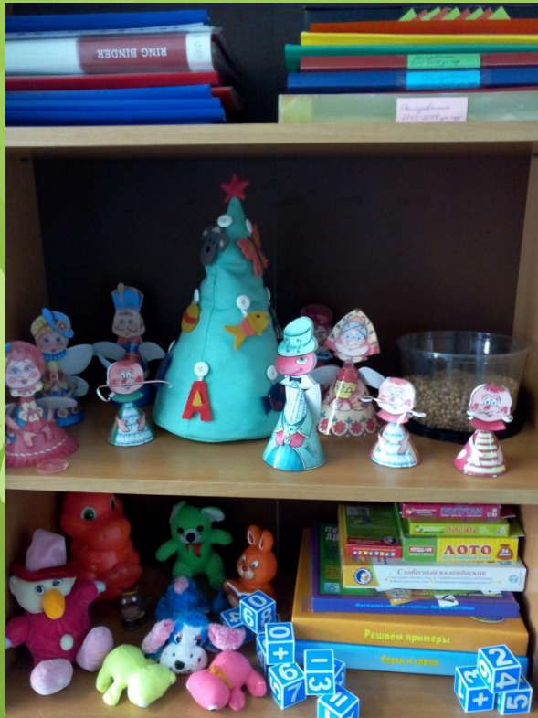
Материалы дефектологическ ого обследования