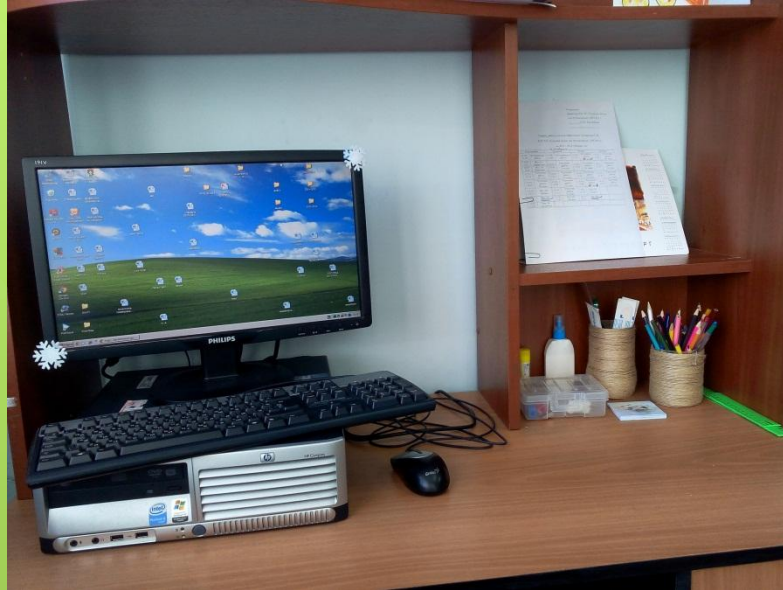
Рабочая зона учителя-дефектолога