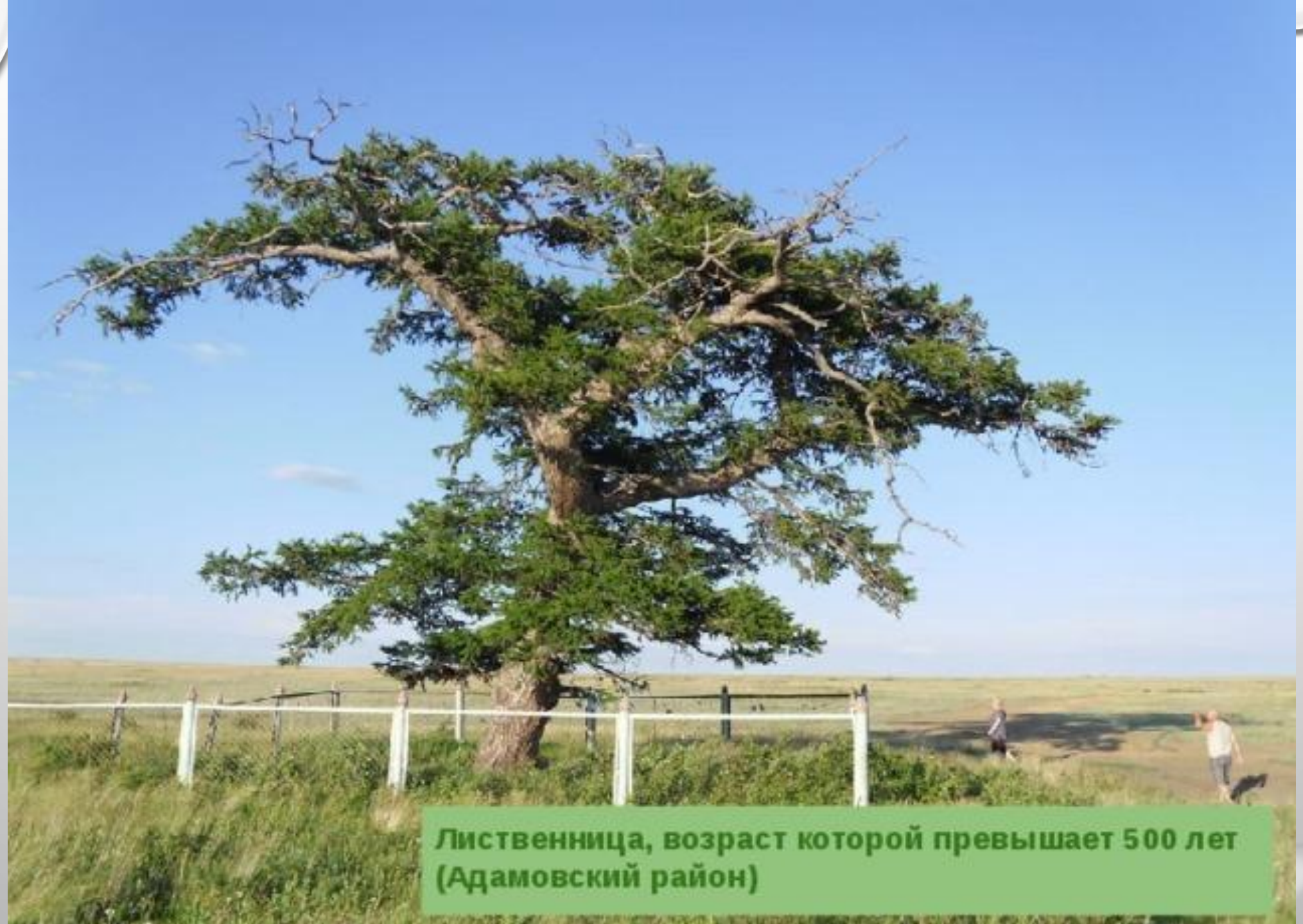
Лиственница, возраст которой превышает 500 лет (Адамовский район)