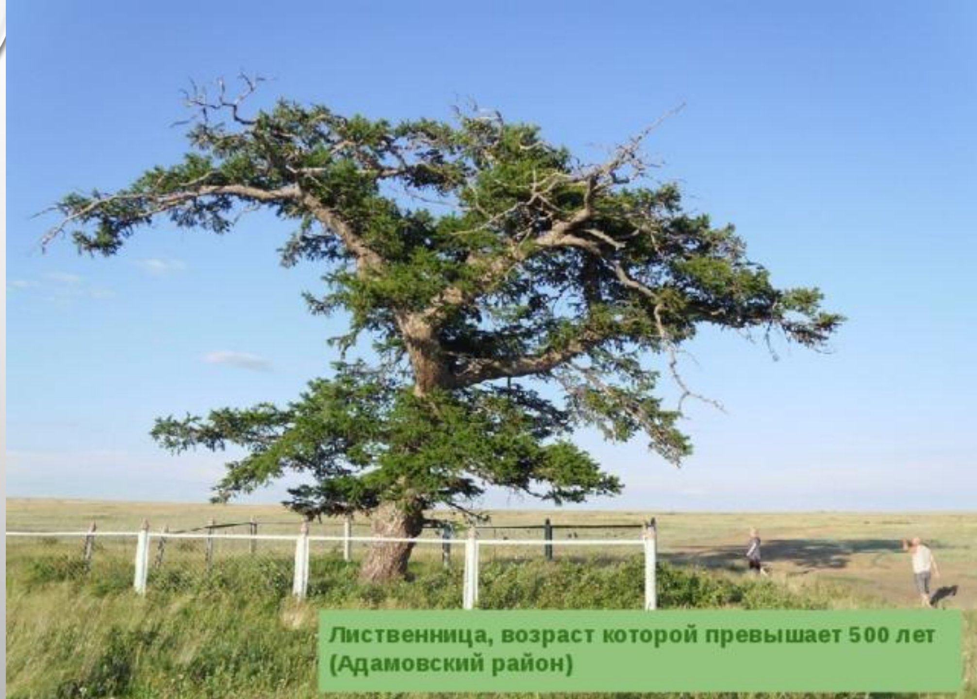
Лиственница, возраст которой превышает 500 лет (Адамовский район)