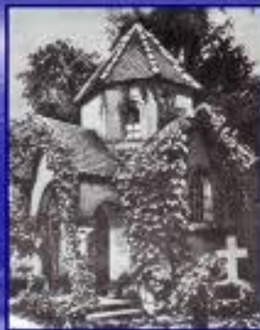
Байройт. Могила и мавзолей Ференца Листа