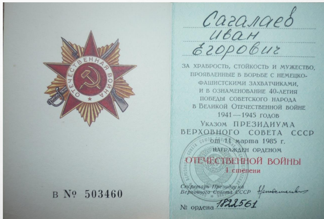
Удостоверение к Ордену Отечественной войны I степени