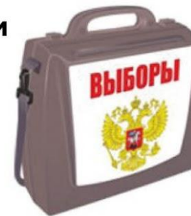
Переносные ящики голосования