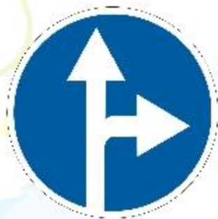
Движение прямо и направо