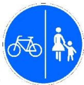
Дорожка для пешеходов и велосипедистов