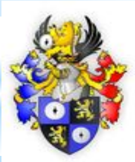
Германский дворянский герб