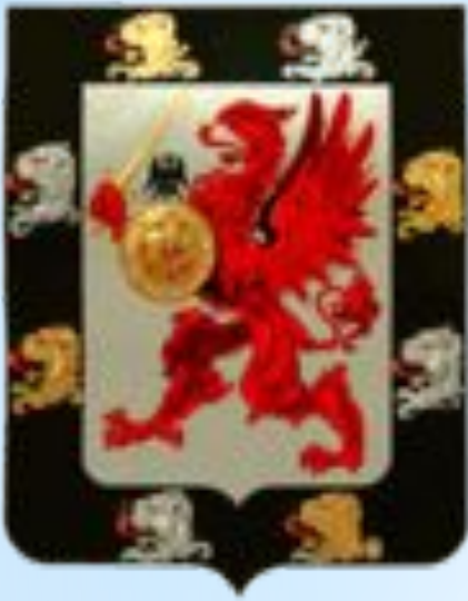
Родовой герб Романовых