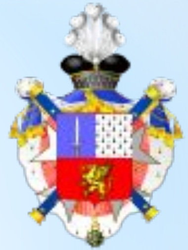
Герб наполеоновского графа