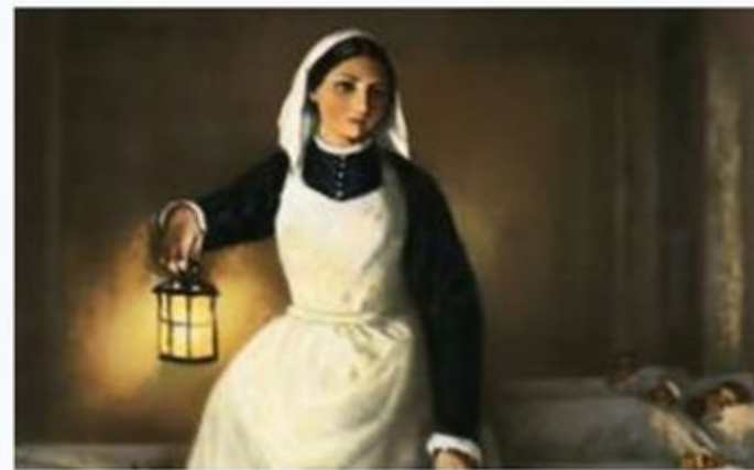
«Леди со светильником»