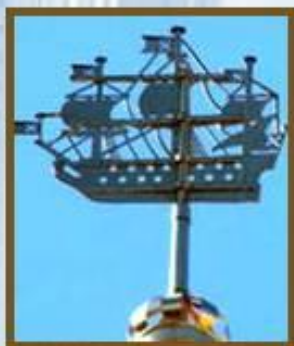
Кораблик на шпиге Адмиралтейства