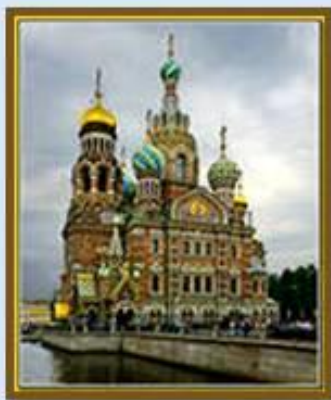
Храм Спас на Крови