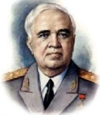
Композитор Александр Васильевич Александров

Россия - священная наша держава, Россия - любимая наша страна. Могучая воля, великая слава - Твое достоянье на все времена!