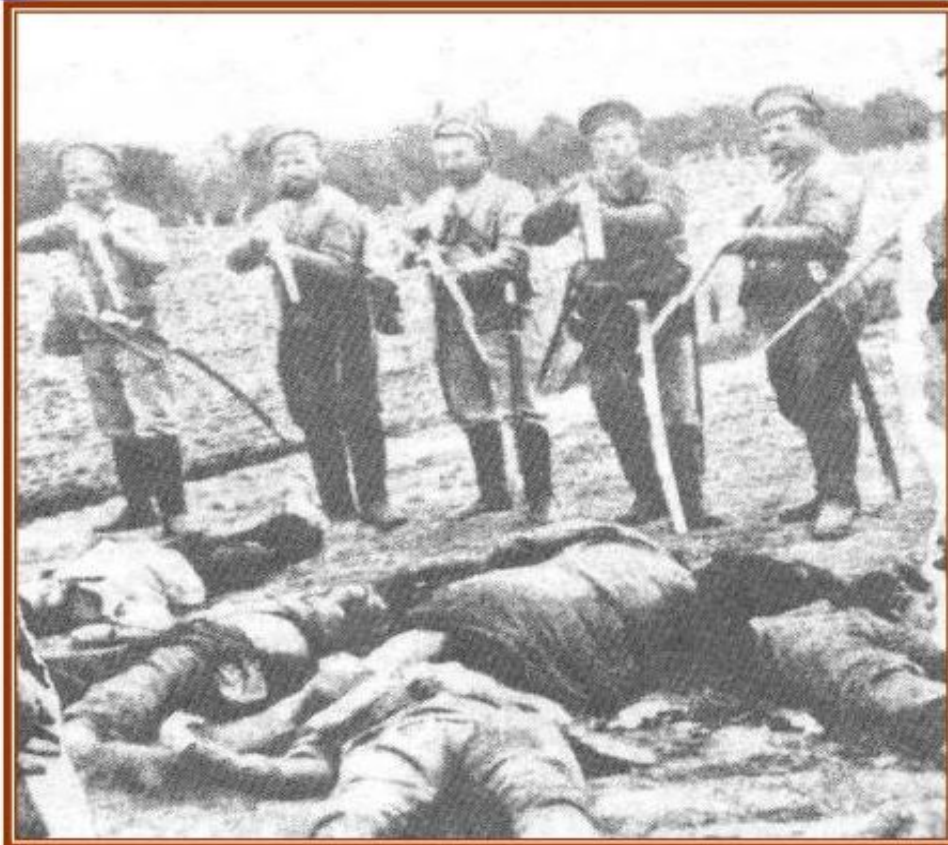
Казачи атамана Дутова позируют после расстрела членов сельсовета

Все рядом лежат Не развестъ межой. Поглядеть: солдат. Где свой, где чужой? Белый – красным стал: Кровь обагрила. Красным был – белым стал: Смерть побелила