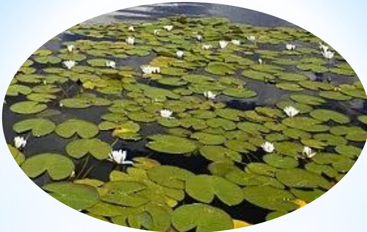
ОЗЕРО «АЗАС» Тоджинский район