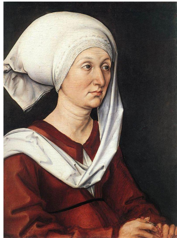
Барбара Дюрер, урождённая Хольпер, Нюрнберг,