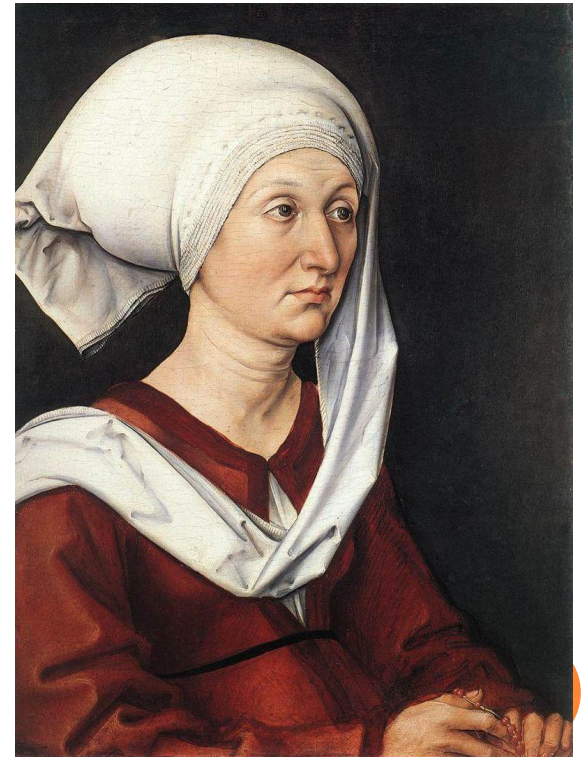
Барбара Дюрер, урождённая Хольпер, Нюрнберг,