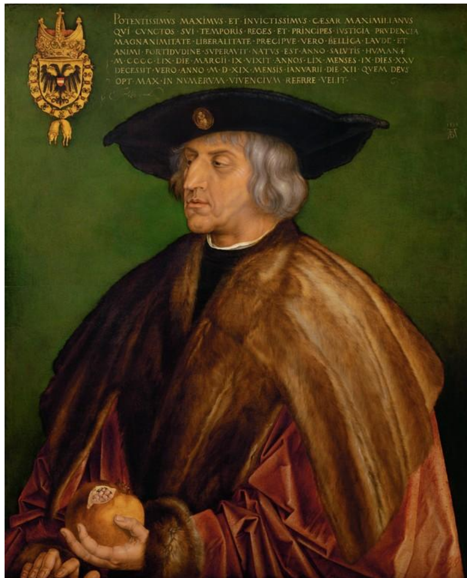
□ А. Дюрер. Портрет Максимилиана I