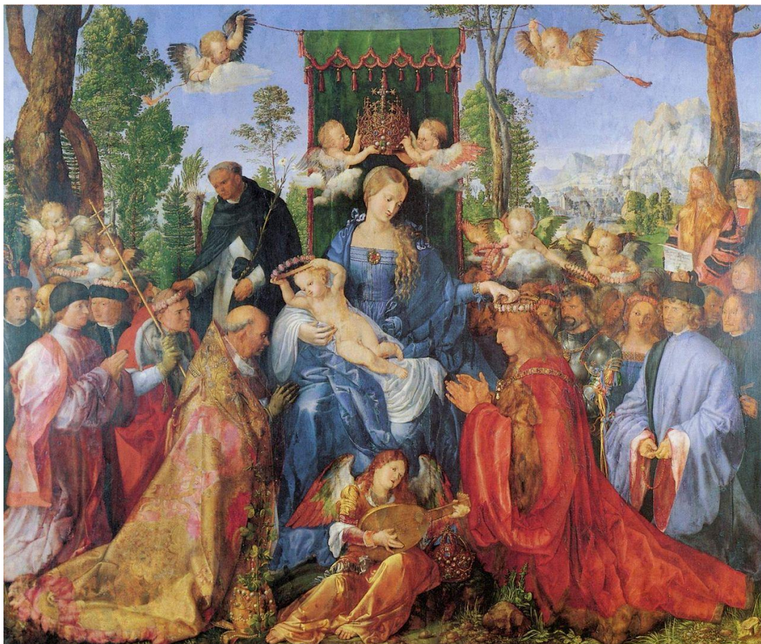
▣ Праздник венков из роз. (1506)