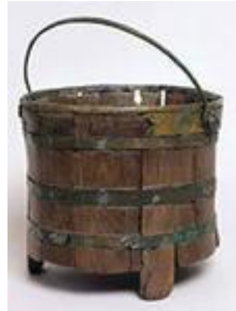
Коромысло с ведрами