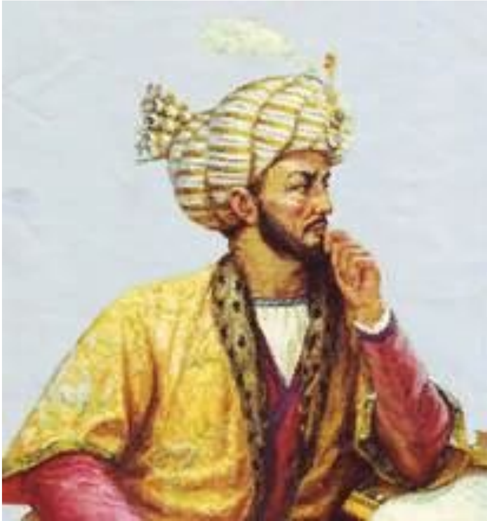
Основатель империи Великих Моголов-Бабур.

Империя Великих Моголов – государство, существовавшее более 300 лет. Индия-часть этого великого государства. Эту империю возглавляли правители тюркского происхождения. Ее основатель – Бабур из Могулистана, отсюда и название династии – Моголы.