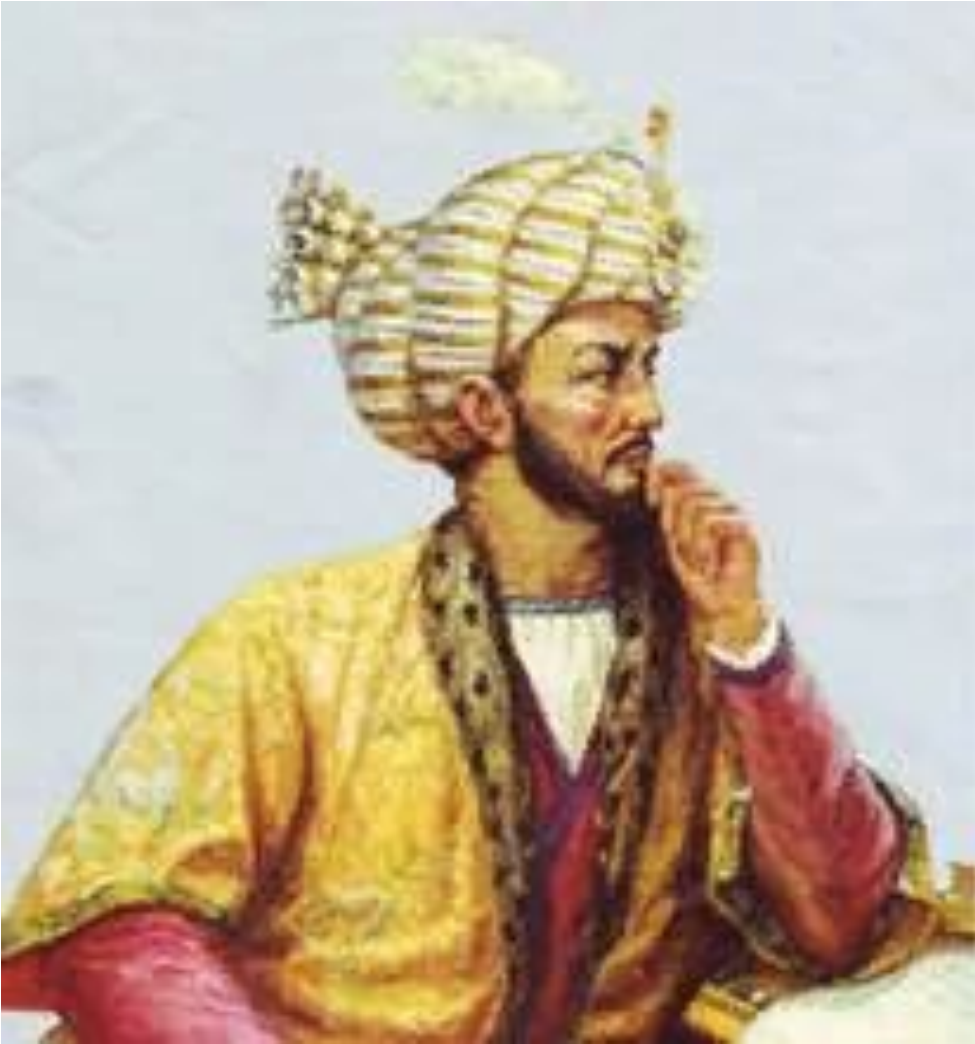
Основатель империи Великих Моголов-Бабур.

Империя Великих Моголов – государство, существовавшее более 300 лет. Индия-часть этого великого государства. Эту империю возглавляли правители тюркского происхождения. Ее основатель – Бабур из Могулистана, отсюда и название династии – Моголы.