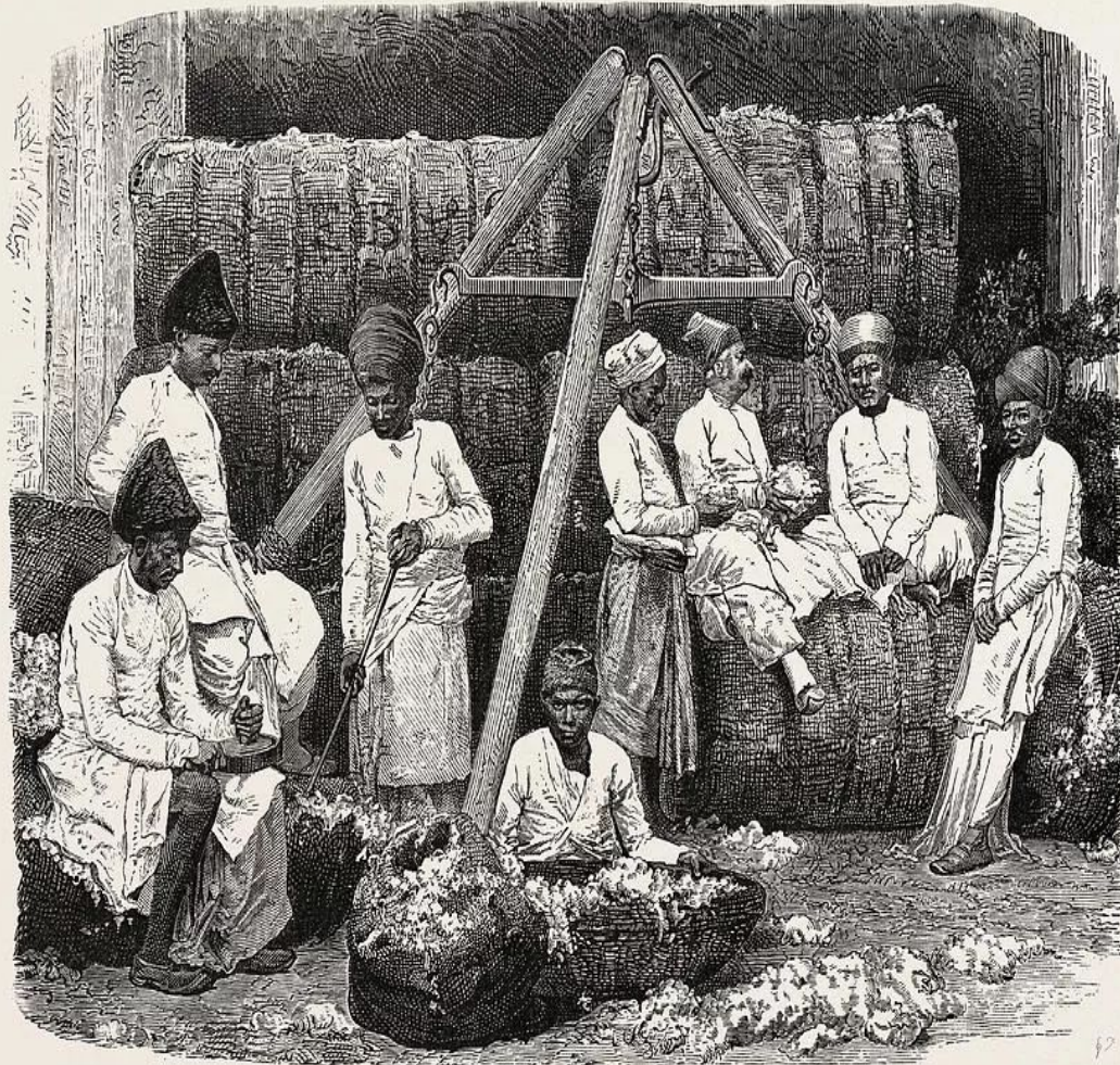
Хозяйство в Индии в 16-17 вв.

В конце XVI—начале XVII веков в императорстве Великих Моголов происходил экономический и культурный подъем. Прекращение феодальных войн на большей части территории оказало положительное влияние на сельское хозяйство, ремесло и торговлю. Возросло значение городов как экономических центров. Развивались также товарно-денежные отношения, расширялась торговля. Поддерживались торговые связи по морским путям с Китаем, Ираном, Африкой, Аравией и странами Европы.