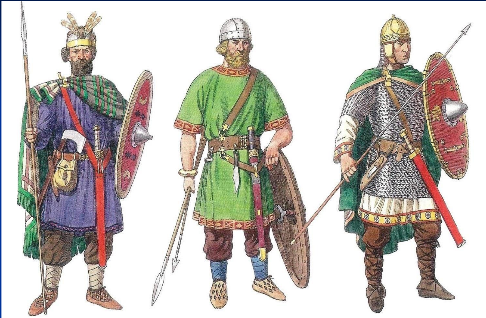
Германские воины: алеманн, вестгот, франк. Рисунок