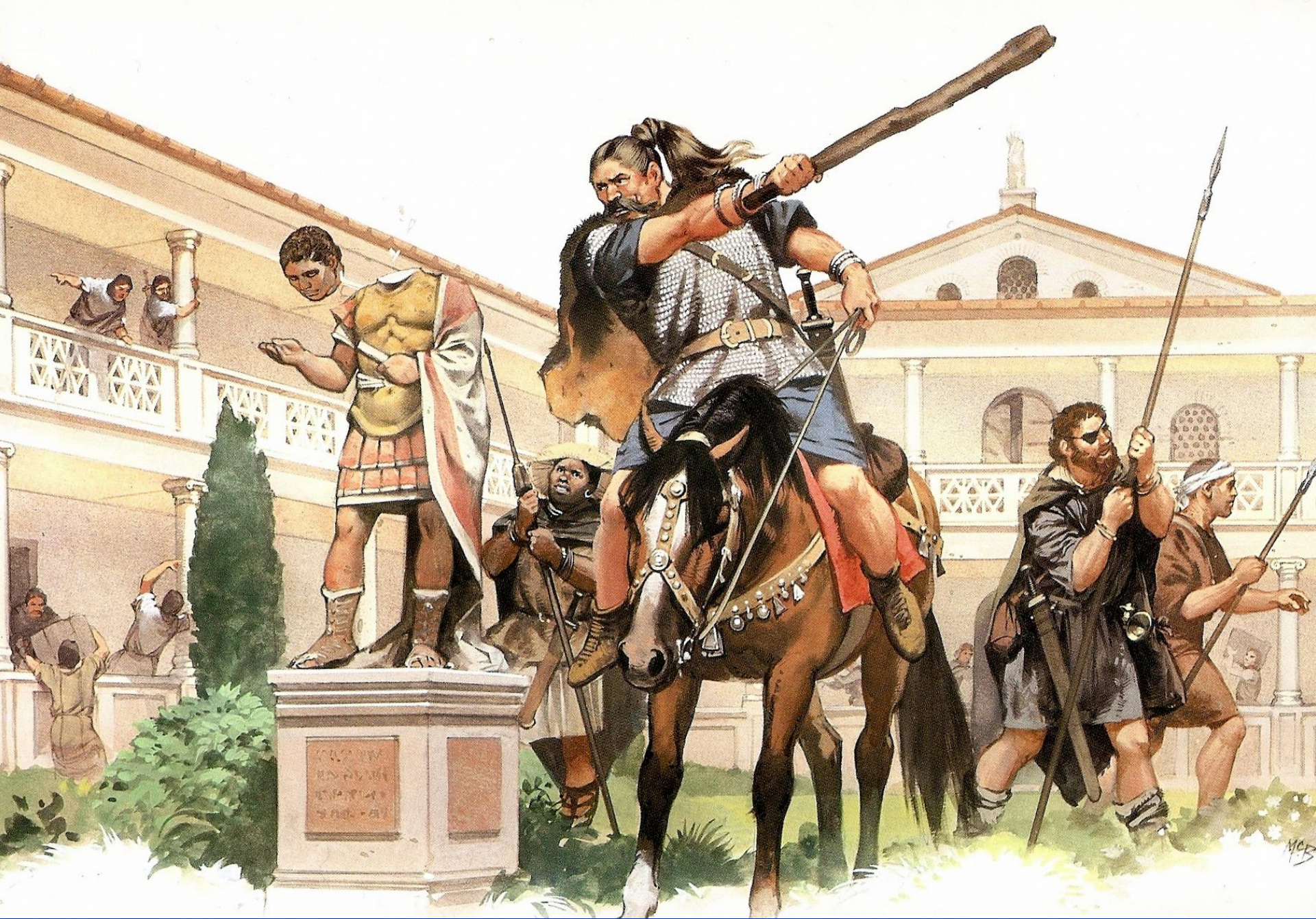
Разграбление Рима варварами. Рисунок