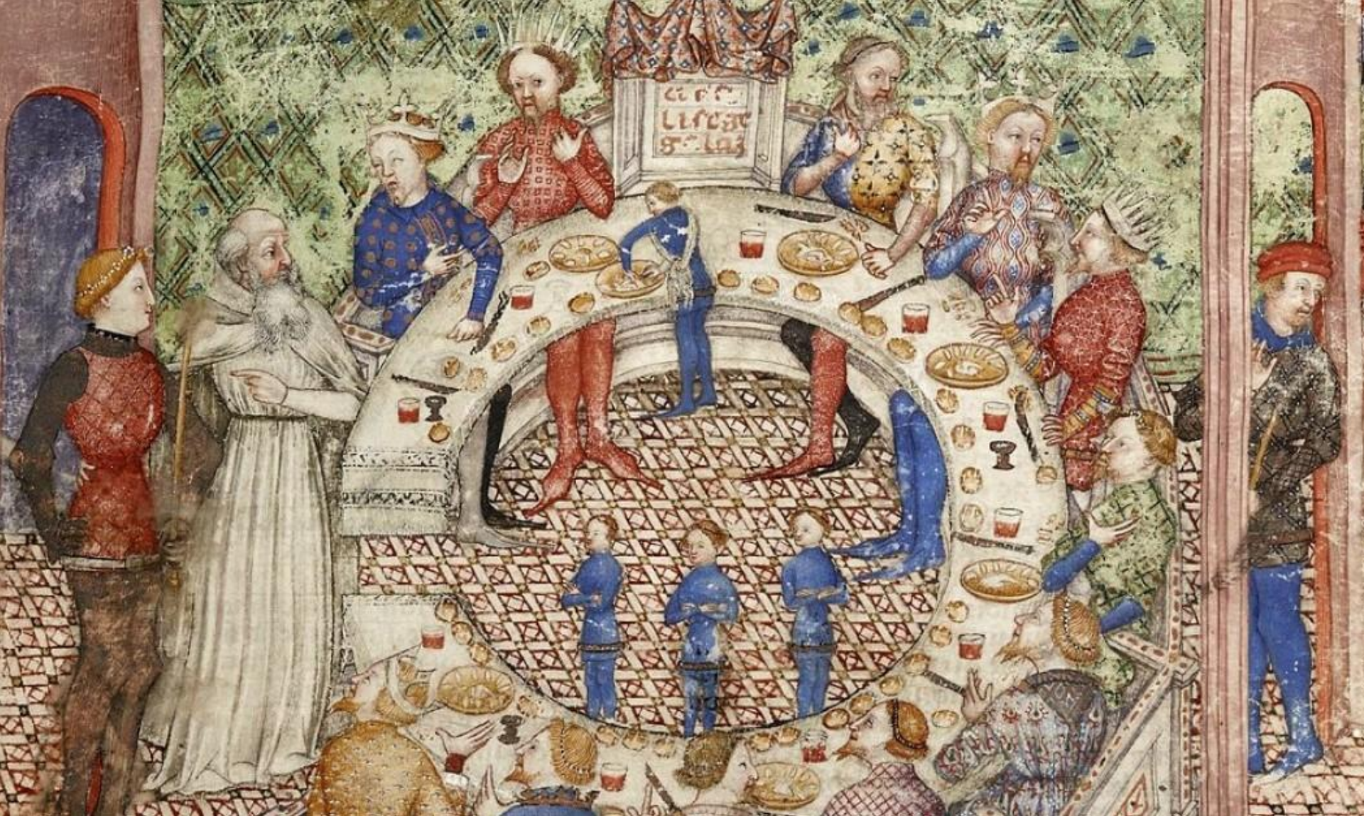
Король Артур и рыцари Круглого Стола. Средневековая миниатюра