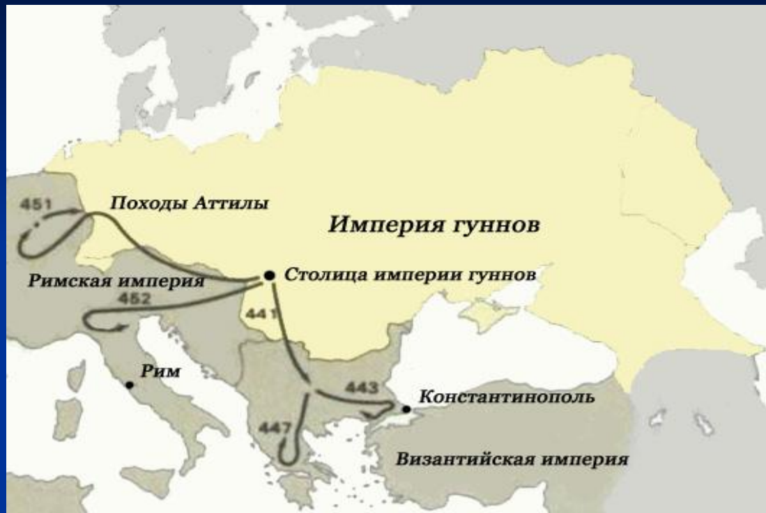
Вторжения гуннов. Карта

451 – битва на Каталаунских полях , победа римлян и вестготов над гуннами