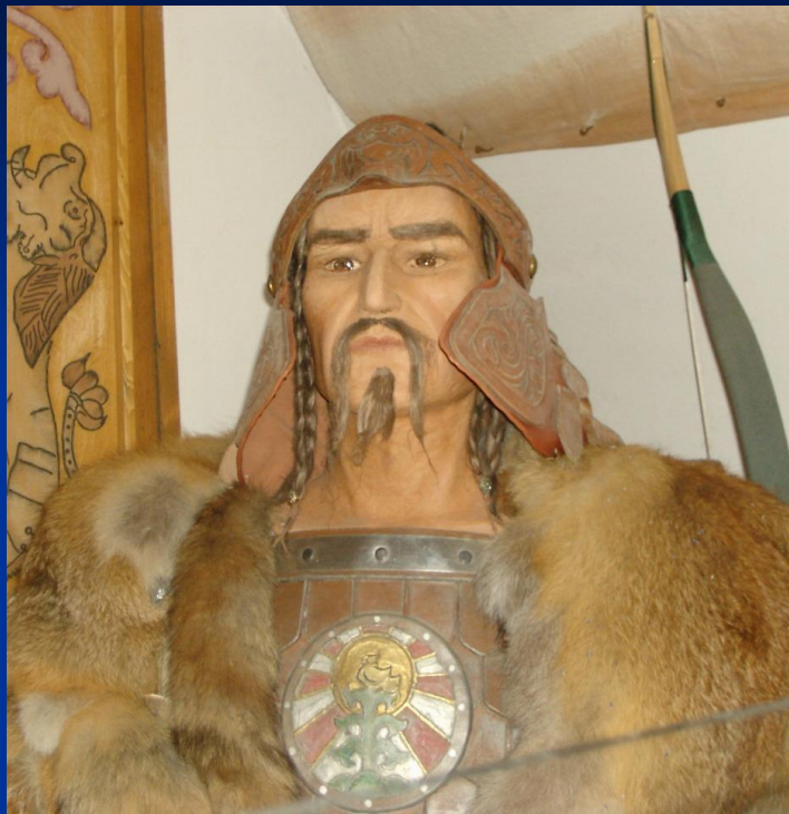
Аттила – вождь гуннов. Реконструкция