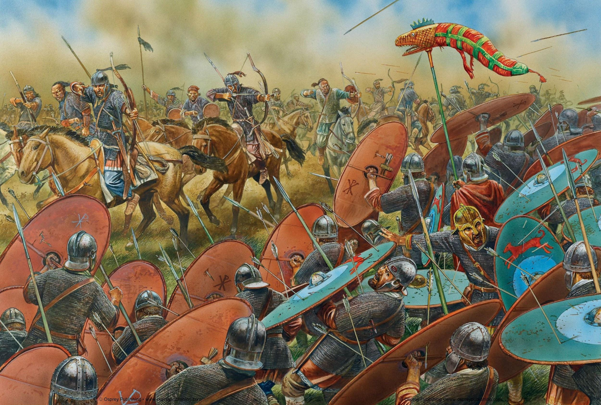
Битва на Каталаунских полях. Рисунок