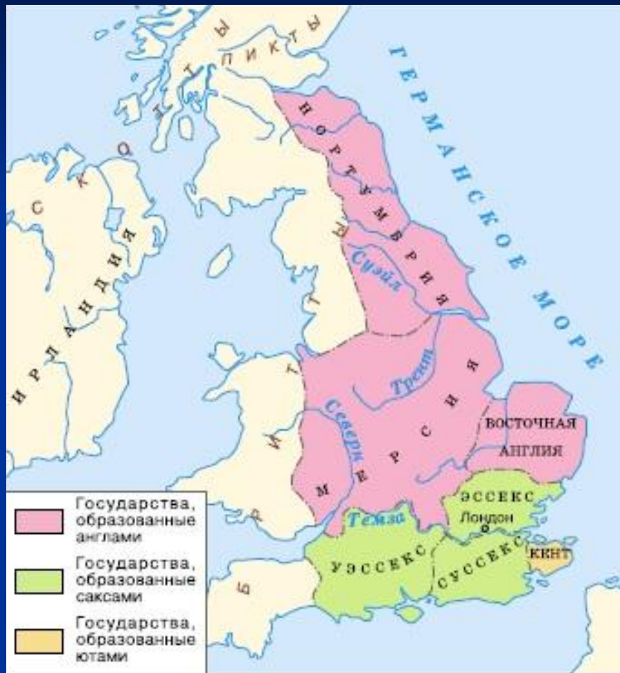
Варварские королевства в Британии. Карта

V в. – вторжение саксов, англов и ютов в Британию, образование семи варварских королевств