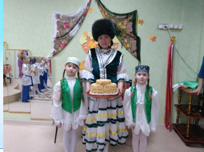
Традиционное празднование Дня народного единства!