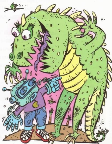
Рис. Александра ЕГОРОВА

«Разве такое возможно?» – удивится читатель. Конечно! В Токио, в национальном музее науки вы легко справитесь с этой задачей. При входе в его помещения вам выдадут особый шлем и перчатки, соединённые проводами. И без всякой волшебной палочки вы можете побродить по доисторическим ландшафтам нашей планеты, проникнуть в глубины космоса и даже совершить невероятное путешествие по кровеносным сосудам человека.