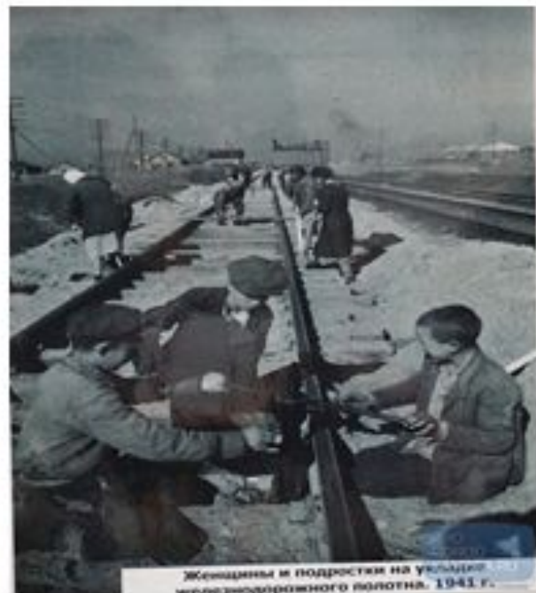
Женщины и подростки на участке железнодорожного полотна. 1941 г.