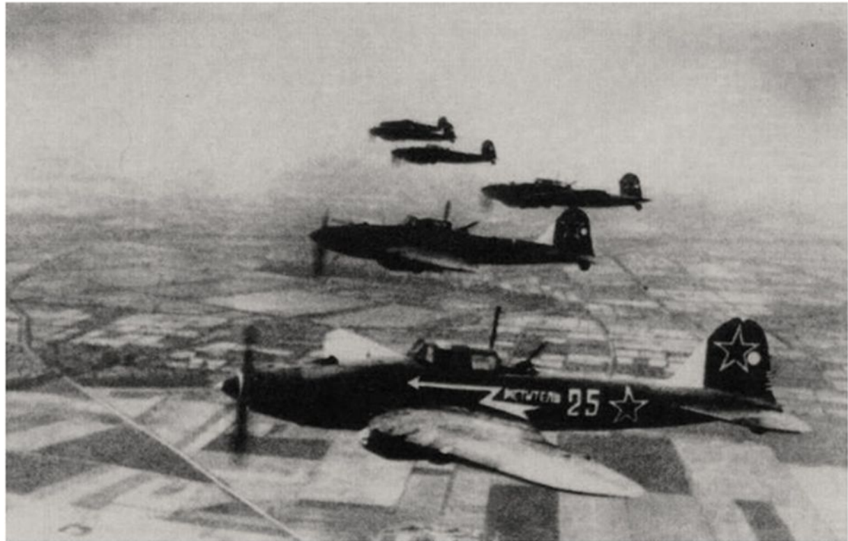
Куйбышев. Самолеты Ил. 1944 год. А.с. Г.В. Бичурова