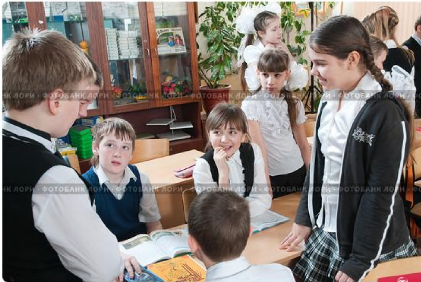
Общение детей на перемене в школе