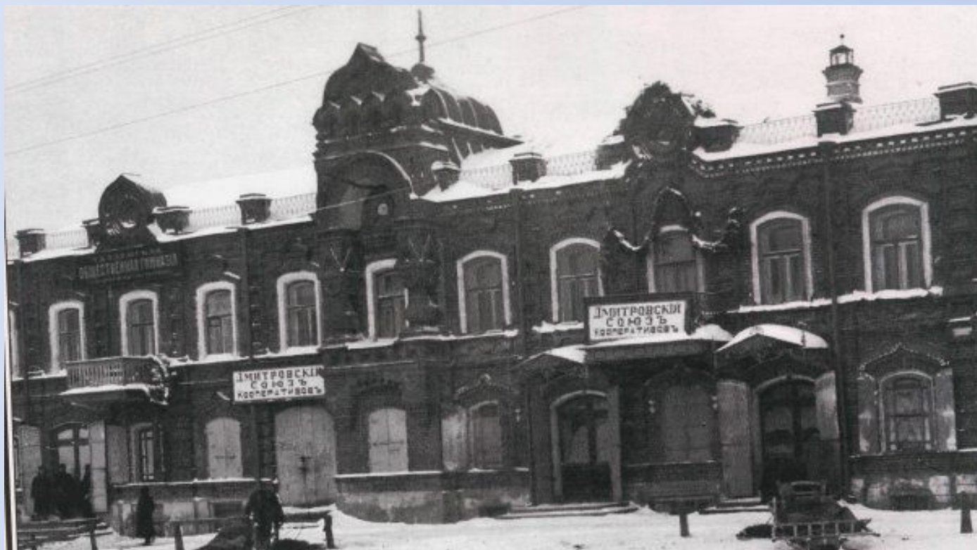
Бывший дом купца Киселева (ныне - библиотека). 1920-е гг