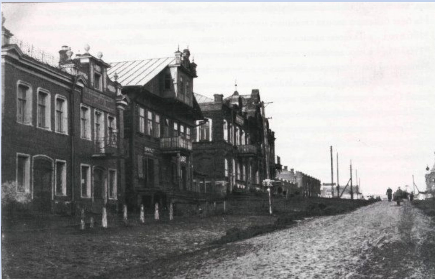
Московская улица (ныне - Салтыкова-Щедрина). 1920-е гг.