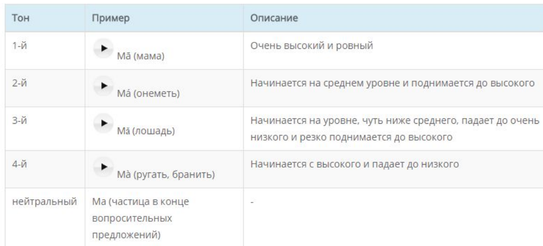
Таблица звуков в китайском языке