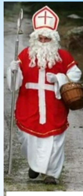
Микулаш из Чехии