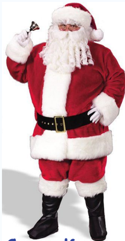
Санта Клаус из Америки