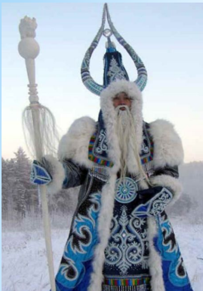
Чысхаан из Якутии