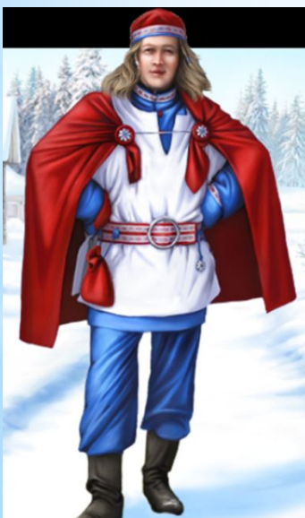
Паккайне из Карелии