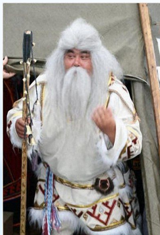
Ямал Ири с полуострова Ямал