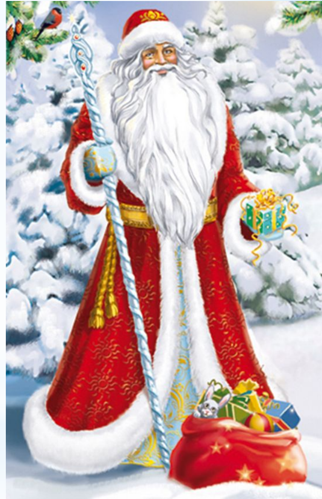
Современный Дед Мороз