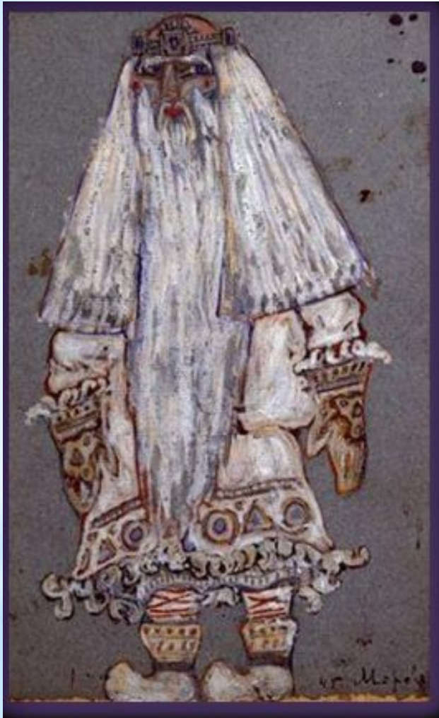
Древний Дед Мороз