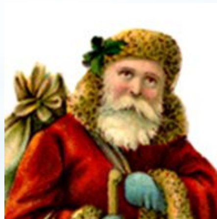
Святой Николай из Бельгии