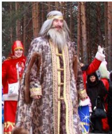
Царь Берендей из Переславля- Залесского