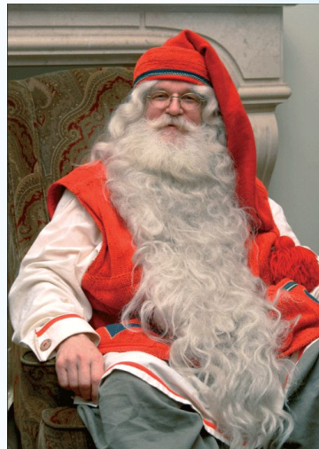
Йоулупукки из Финляндии