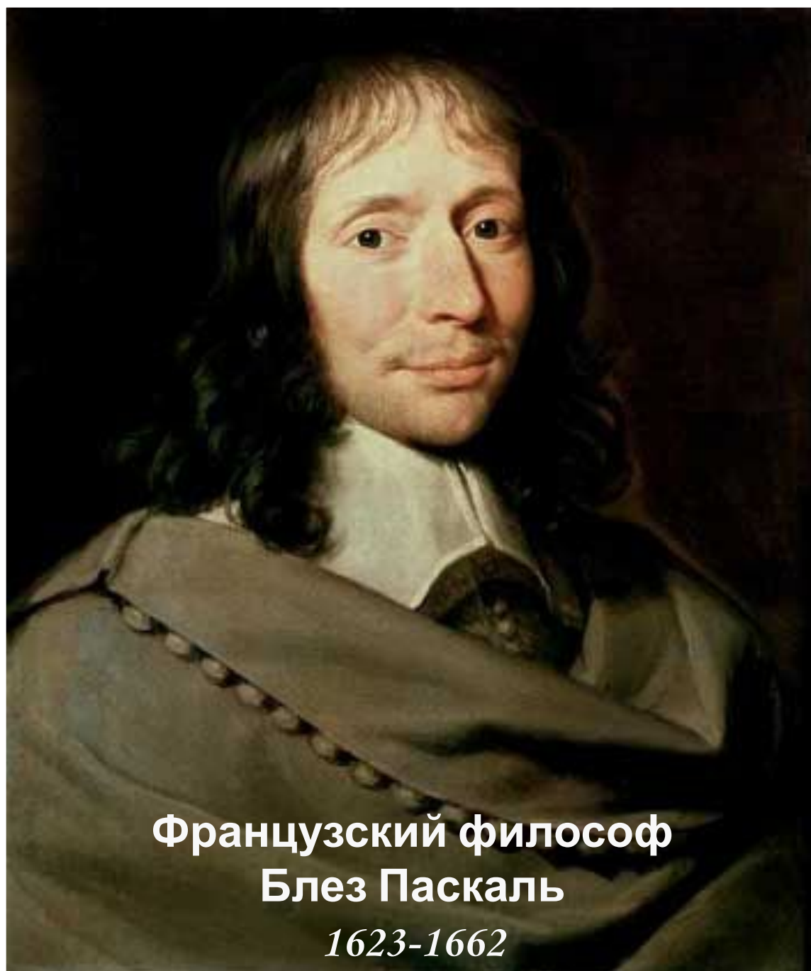
Французский философ Блез Паскаль 1623-1662

«Какая это странная живопись - натюрморт: она заставляет любоваться копией тех вещей, оригиналами которых не любишься».