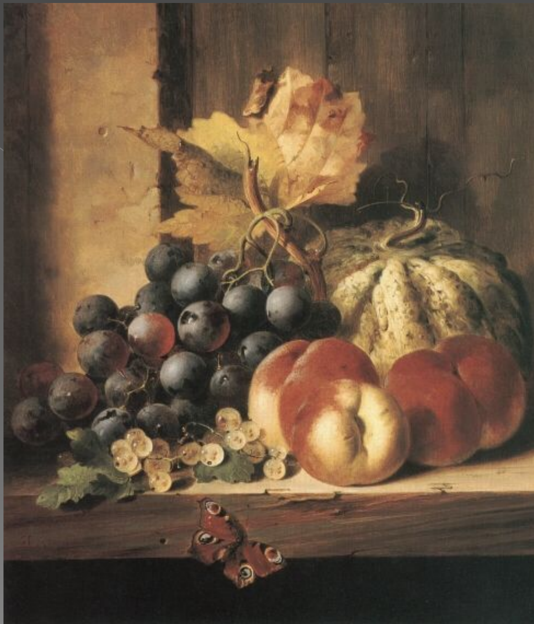
Эдвард Ладелл «Натюрморт с фруктами»