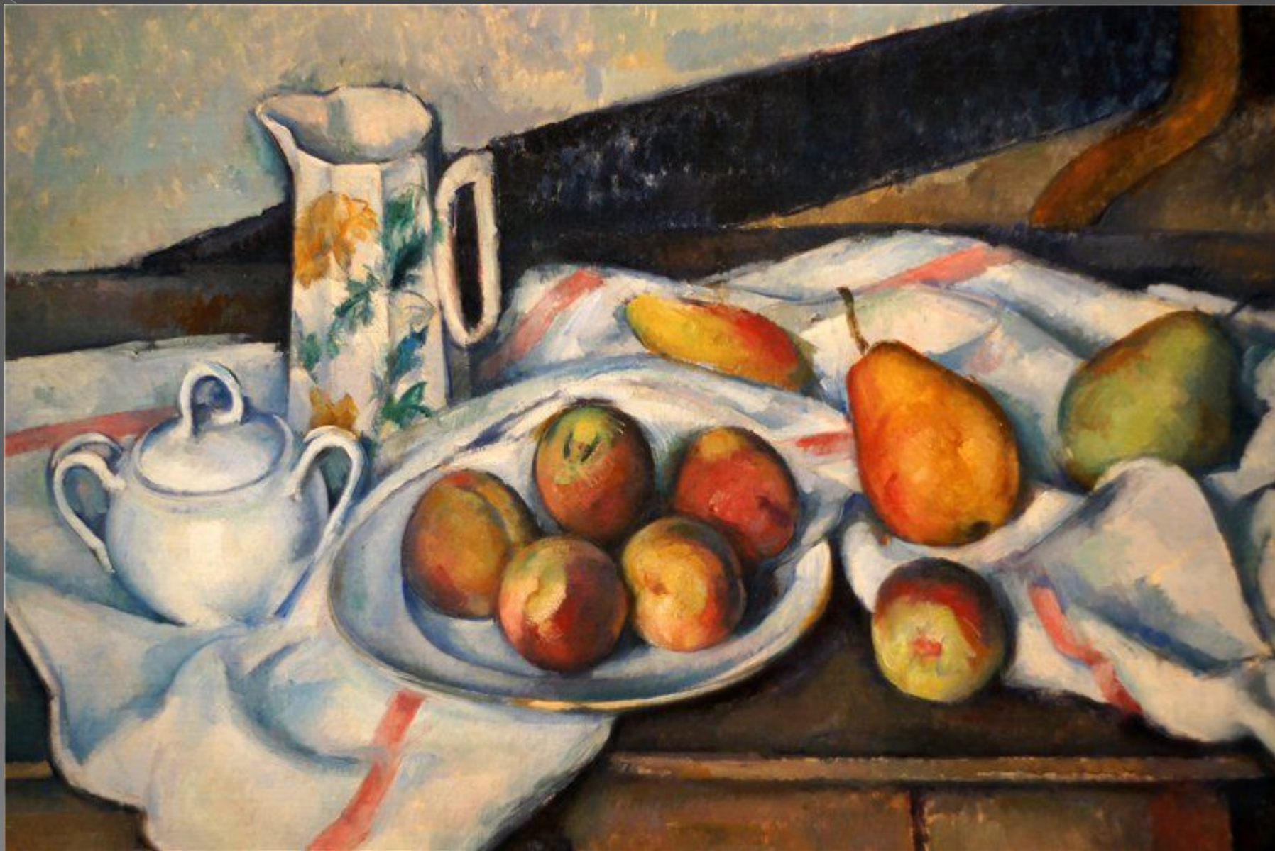
Поль Сезан «Персики и груши»