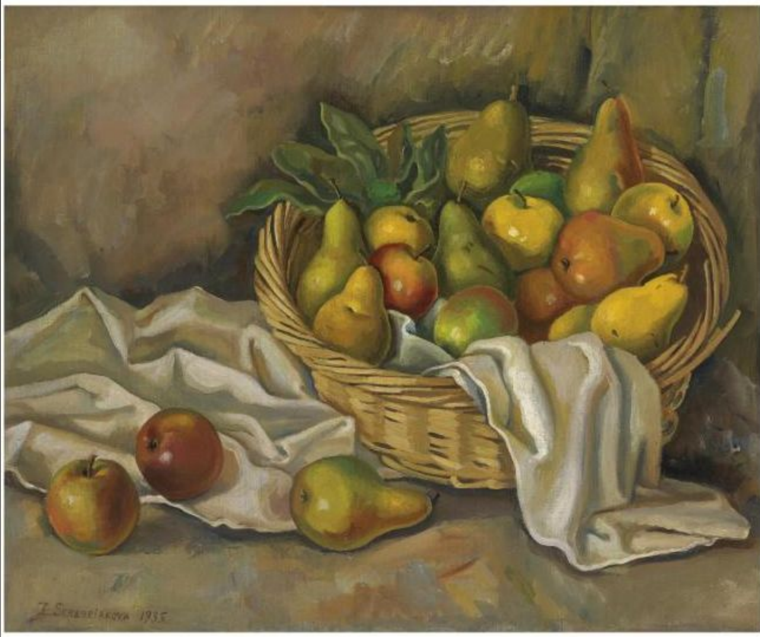
Е. Серебрякова «Натюрморт с яблоками и грушами»