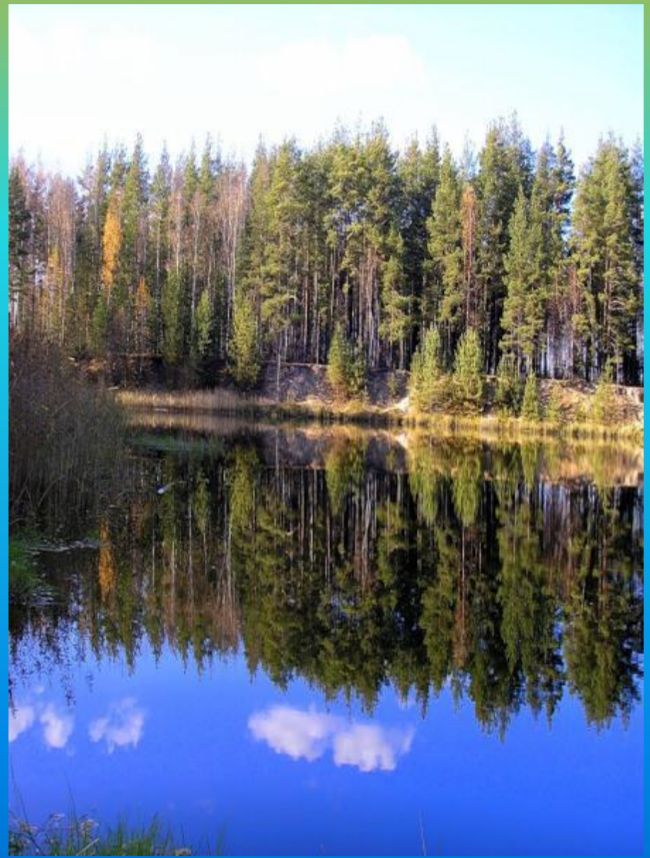
Короткая, теплая весна