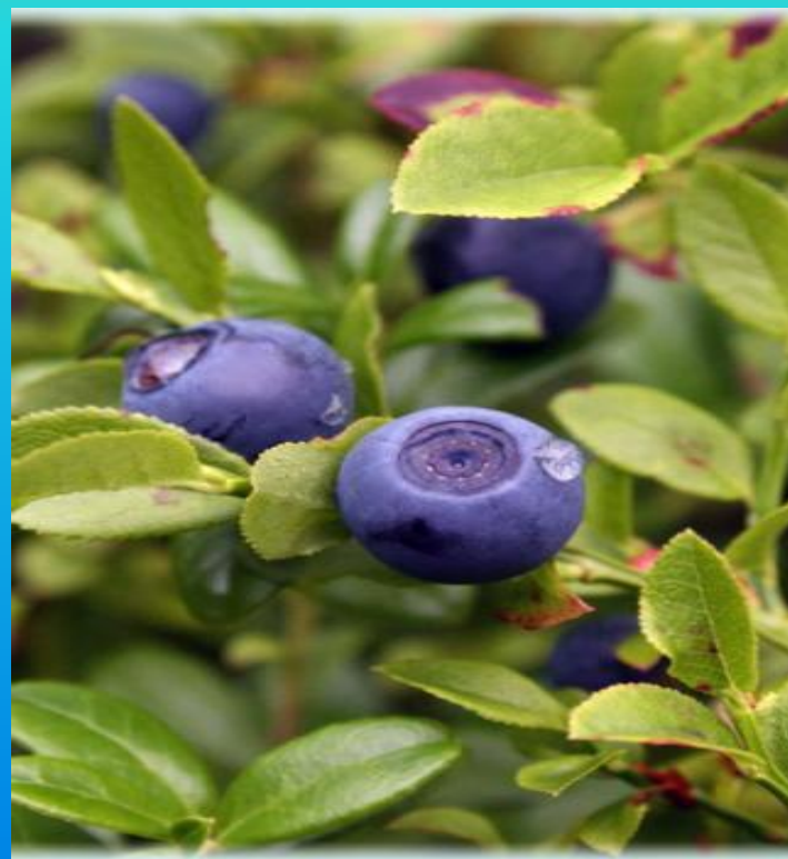
КАЛИНА, ЧЕРНИКА, БРУСНИКА